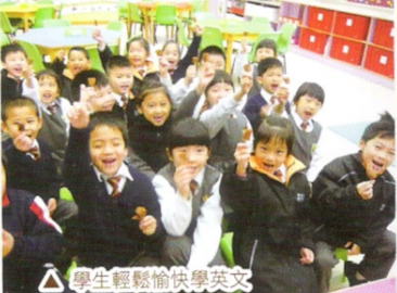
△ 學生輕鬆愉快學英文