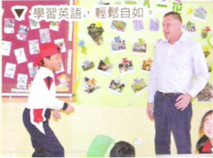
▽ 學習英語，輕鬆自如。