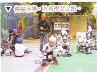
▽ 傳媒報導，冰球學習之路。