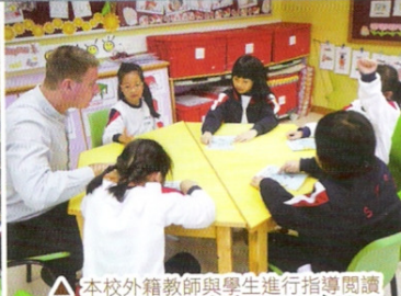
△ 本校外籍教師與學生進行指導閱讀