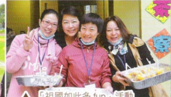
△ 家長義工與老師同心協力，令運動會賽事得以順利進行。