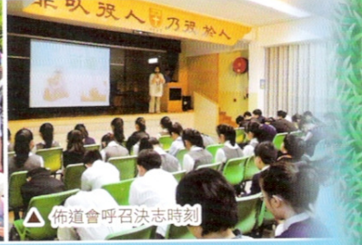
佈道會呼召決志時刻