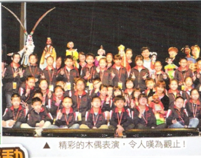
▲ 精彩的木偶表演，令人嘆為觀止！