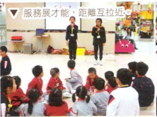
▽ 服務展才能，距離互拉近。