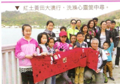
▽ 紅土黃田大湧行，洗滌心靈箇中尋。