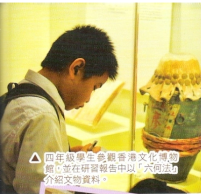
△ 四年級學生參觀香港文化博物館，並在研習報告中以「六何法」介紹文物資料。