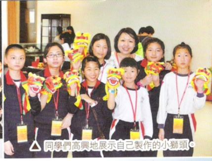
△ 同學們高興地展示自己製作的小獅頭。