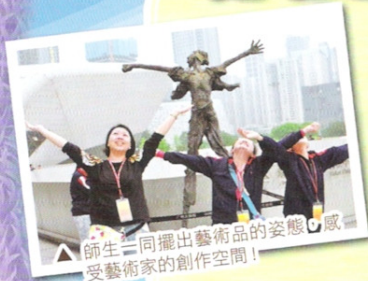
▲ 師生一同擺出藝術品的姿態，感受藝術家的創作空間！

本年度學校舉辦了佛山、廣州嶺南文化體驗遊的兩天內地交流團，讓五年級的學生體驗及學習中國文化。在第一天的旅程中，我們參觀了廣州粵劇學院，學生除了欣賞粵劇表演外，還可以學習傳統的粵劇技巧，讓同學大開眼界。下午我們參觀佛山民間藝術社，學習製作小獅頭，同學們非常投入，作品亦栩栩如生。