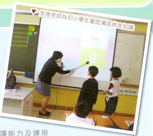
▽ 支援老師為初小學生鞏固漢語拼音知識

本校自 2009-2010 學年起推行以普通話教中文的措施。本校透過參與教育局的專業發展計劃、及與內地教師交流和協作，更加強中文科教師培訓，以優化教材和教學策略。現時學校於小二至小四級別以普通話教授中文的措施，藉此提升學生語文學習的成效。