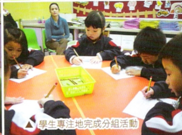
△ 學生專注地完成分組活動