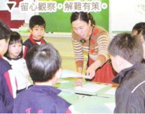
▽ 留心觀察，解難有策。