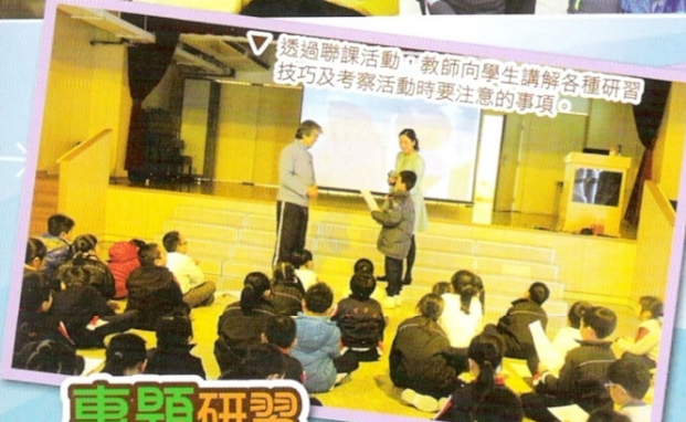
▽ 透過聯課活動，教師向學生講解各種研習技巧及考察活動時要注意的事項。