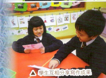
△ 學生互相分享寫作成果