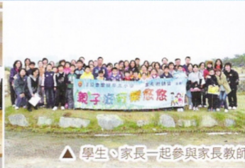
△ 學生、家長一起參與家長教師會親子旅行，齊齊親視大自然！