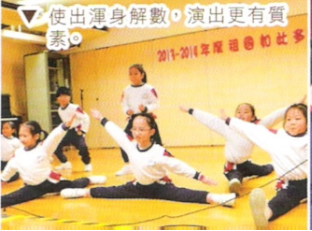
▽ 使出渾身解數，演出更有質素。