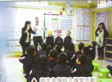
△ 師生全情投入課堂活動