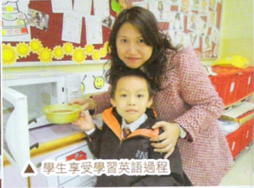
△ 學生享受學習英語過程