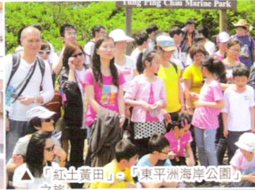
「紅土黃田」 之「東平洲海岸公園」 之旅