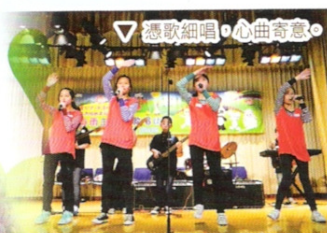
▽ 憑歌細唱，心曲寄意。