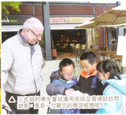
△ 三年級的學生嘗試運用英語及普通話訪問遊客，真是一次難忘的學習經歷呢!!