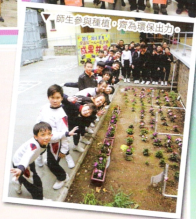
▽ 師生參與種植，齊為環保出力。

為使學生在德、智、體、群、美和靈六育上得到全人發展，學校提供不同性質的興趣班，如跆拳道班、拉丁舞班、小提琴班、珠心算班、3D 動畫製作班、機械人製作班、創意繪畫班、奧林匹克數學班、英語拼音及戲劇班、球類訓練班、藝術體操班、冰球訓練班及游泳訓練班等，由專業導師負責指導，以培養學生不同的技能和情操。本校拉丁舞班學生曾多次參加對外比賽，其中在「金鑽杯系列亞洲公開賽：全港兒童及青少年明日之星選拔賽」及「第 21 屆 IDTA CUP」比賽中，囊括多個獎項。