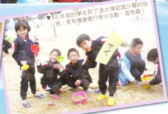
▽ 三年級的學生到了淺水灣認識沙灘的設施，更有機會進行堆沙活動，真有趣!