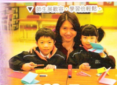
▽ 師生展歡容，學習倍輕鬆。

第二天，我們到達廣州的新地標 - 廣州大劇院。院內的藝術品讓同學對藝術有另一番的體會。隨後，我們還到廣州木偶藝術中心，讓學生認識木偶藝術，欣賞木偶表演和製作自己的木偶。同學們對此活動印象深刻，亦加深他們對祖國文化的認識。