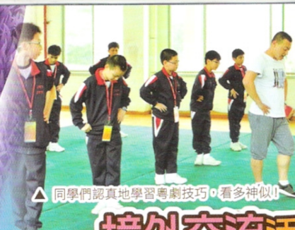
△ 同學們認真地學習粵劇技巧，看多神似！