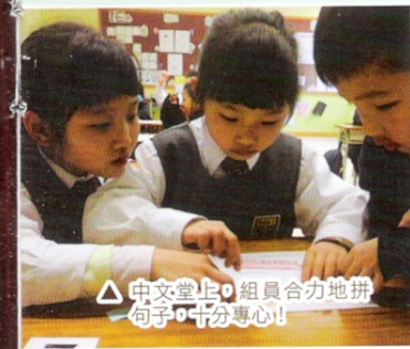
中文堂上，組員合力地拼 句子，十分專心！

本校十分重視照顧不同學生的學習需要，因此，藉着小班的教學優勢，優化課堂教學。本校透過「小班教學推廣小組」適時推行專業交流活動，從而提升教師運用小班教學策略的技巧。同時，我們會透過多元化的評估，強調學生學習的過程，展示學生學業以外的良好表現。除此以外，我們還十分重視同儕之間的合作，通過聯課及課堂上常規的訓練，以提升學生的社交技巧。在校外評核期間，外評人員指出本校教師能在教學設計上適切地運用小班教學策略，多安排兩人或小組活動，增加朋輩間合作機會，讓能力不同的學生參與學習，對教師的教學表現甚為讚賞。而外評人員亦表揚本校學生的學習，稱讚他們表現投入，能專心聆聽教師講解，認真回應教師提問，積極參與課堂活動，表現十分理想。