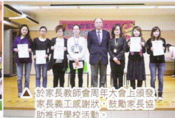
△ 於家長教師會周年大會上頒發家長義工感謝狀，鼓勵家長協助推行學校活動。