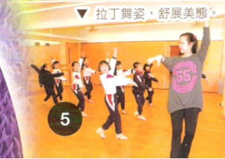
▽ 拉丁舞姿，舒展美態。