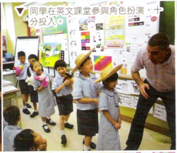
同學在英文課堂參與角色扮演， 十分投入。