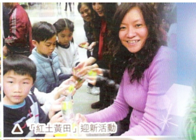
「紅土黃田」 迎新活動