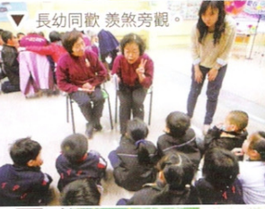
▽ 長幼同歡 羨煞旁觀。