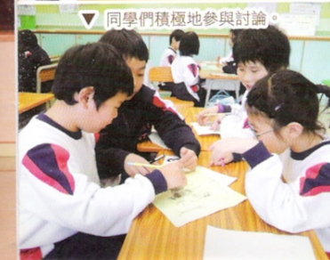
同學們積極地參與討論。