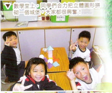
數學堂上，同學們合力把立體圖形拼 砌一個城堡，大家都很有興奮！