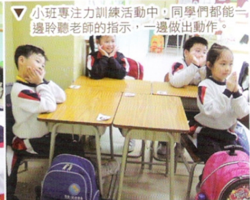
小班專注力訓練活動中，同學們都能一 邊聆聽老師的指示，一邊做出動作。