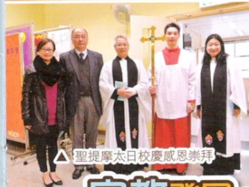
聖提摩太日校慶感恩崇拜