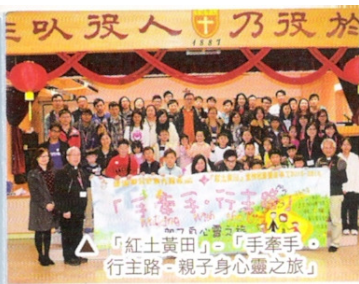
「紅土黃田」 行主路「親子身心靈之旅」