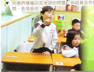
同學們積極回答老師的問題，與組員合作無 間，表現甚佳！