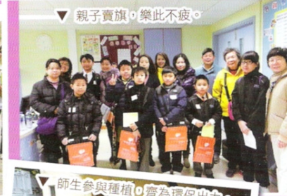
▽ 親子賣旗，樂此不疲。