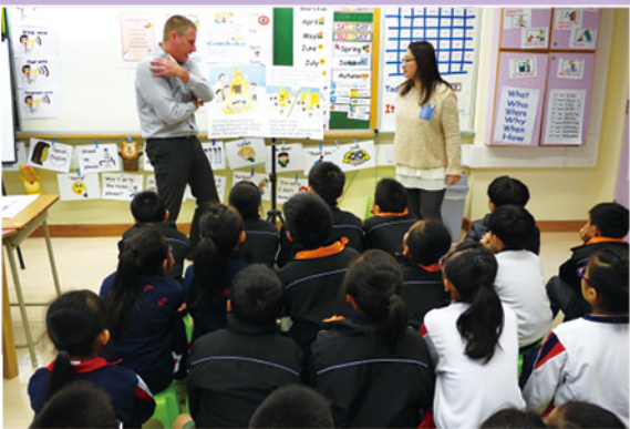
▼ 透過不同的課堂活動，學生積極投入、專注學習，提升了自信心及表達力。

為營造豐富的語言環境及提升學生英語的興趣，本校於一至三年級推行「小學識字計劃 - 閱讀及寫作 (PLP-R/W)」，由外籍英語教師、英文科任老師及英語教學助理以靈活及多元化的教學模式共同協教，於低年級課程內加插圖書教學，並強調拼音元素及閱讀技巧，藉此培養學生英語讀寫的能力。老師一方面從不同的閱讀活動，包括閱讀大型圖書 (Shared Reading)、小組導讀 (Guided Reading) 及個人閱讀 (Independent Reading) 訓練學生的英文閱讀技巧，另一方面讓他們「以讀帶寫」，從指導性寫作活動 (Guided Writing) 至過程寫作技巧訓練，循序漸進地掌握英文寫作技巧。學生透過有系統的閱讀及寫作課程，訓練學生聽、說、讀、寫的語文能力。