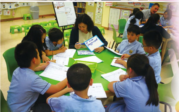
▲ 學生在小組導讀 (Guided Reading) 中學習不同的閱讀策略。