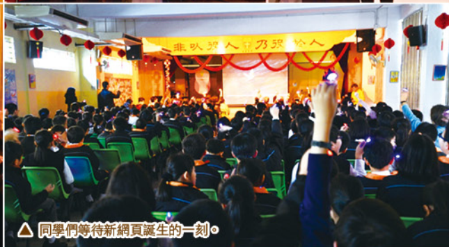
▲ 同學們等待新網頁誕生的一刻。