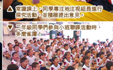
▽三年級同學們參與小班聯課活動時，多麼雀躍！！