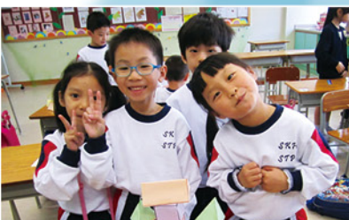
△數學課上，同學合作拼砌立體圖形，這是他們的成果，看他們多滿足！

同時，本校十分重視學生學習的成效，小一級在上、下學期分別製作一份學習歷程檔案。而小一至小三級會有一份學習表現報告，展示學生學習及學業以外的表現。