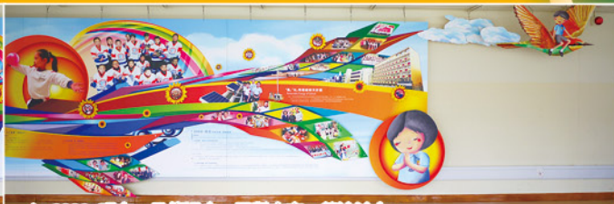
▲ 1957-2002 立根紅燭 默默耕耘 造就人群。