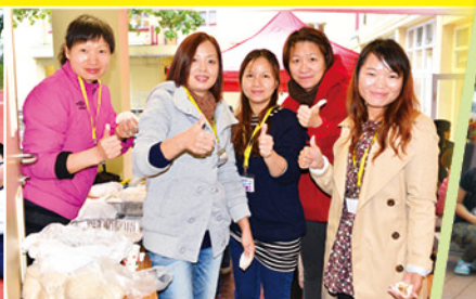
▲ 家長義工正在用心準備「祖國如此多Fun」的食物。