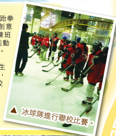
▲ 冰球隊進行聯校比賽。

我們積極推動學生參加校外比賽，爭取佳績，提升自信心，今年學生於「學校音樂創藝展 2014-2015」中榮獲最佳演出獎（小學組）銅獎，又於「2014-2015 學校動感聲藝展」演藝組中榮獲全港第三名。本校英文集誦隊、英文獨誦、普通話獨誦及經文獨誦中獲得多個冠、亞、季軍和優異獎。至於成立達十多年的全港首隊小學流行樂隊 POPY，也多次在全港大型活動及場合中演唱，最近在聖公會九龍東區小學六校聯校畢業典禮有精彩的演出。