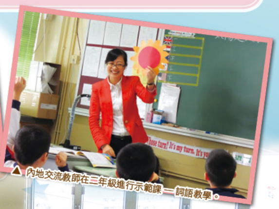
▲ 內地交流教師在三年級進行示範課——詞語教學。