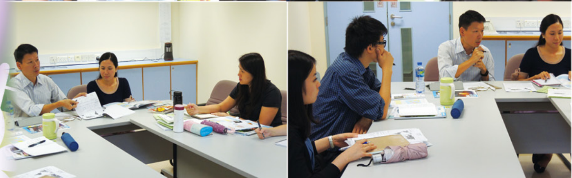
▲ 吳木嘉導師與四年級科任老師進行共同備課會議，參與同工十分投入。