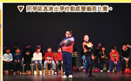
▽ 同學認真演出學校動感聲藝展比賽。