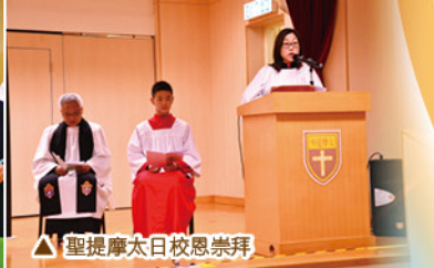
△聖提摩太日感恩崇拜