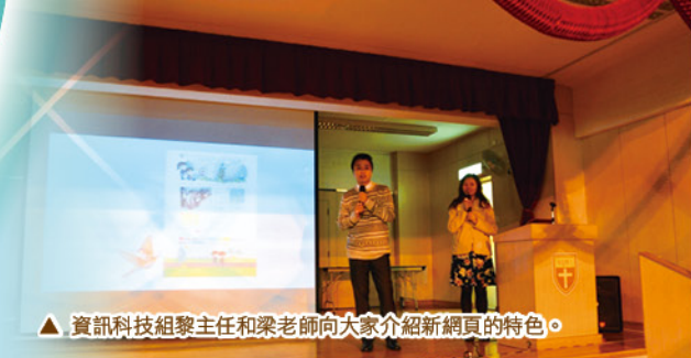
▲ 資訊科技組黎主任和梁老師向大家介紹新網頁的特色。