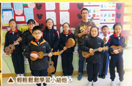
▲ 輕鬆鬆學習小結他。