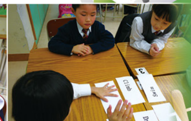
△英文課上，同學在認讀英文動詞字卡。