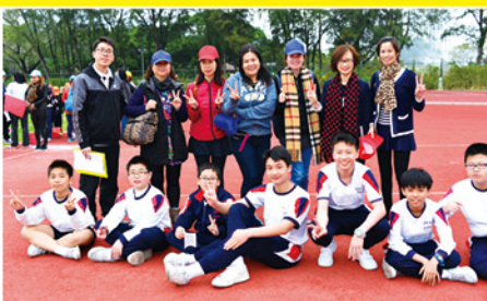
▲ 家長義工和學生十分熱心擔任運動會的工作人員。