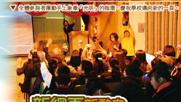
▽ 全體參與者揮動手上象徵「光明」的指環，慶祝學校邁向新的一頁。