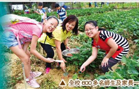
▲全校 600 多名師生及家長一起參與親子旅行，共享歡樂時光。