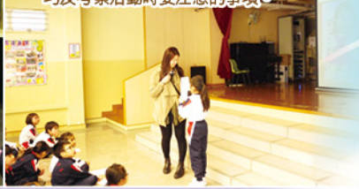
▼透過聯課活動，教師向學生講解訪問技巧及考察活動時要注意的事項。