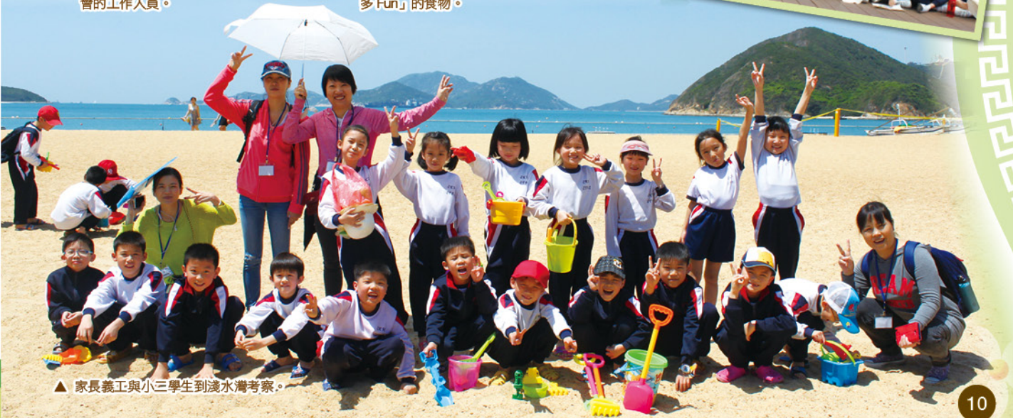
▲ 家長義工與小三學生到淺水灣考察。