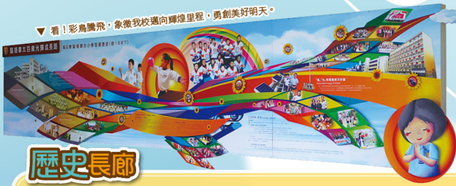
▼看！彩鳥騰飛，象徵我校邁向輝煌里程，勇創美好明天。

為了培養學生的自學和各種共通能力，學校積極推行全方位的專題研習活動。本學年，各級一如以往配合課程擬定不同的專題研習主題。而二年級學生更在中文科、常識科、視藝科和電腦科的老師指導下完成跨學科的專題研習。在進行專題研習之前，各級常識科教師會有系統地教授學生所需的研習技巧，教師又為三至六年級安排聯課活動，好讓學生了解研習重點。此外，學校亦配合研習主題，為學生安排戶外考察。透過實地考察，學生需要觀察和記錄重要的資料，以便完成專題研習的報告。其中，三年級的學生曾到了赤柱，嘗試運用英語及普通話訪問遊客。同學們都非常主動和有自信地完成訪問，難怪遊客們均對同學的表現讚賞不已！