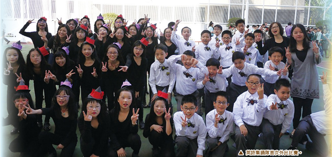
▲ 英詩集誦隊首次外出比賽。