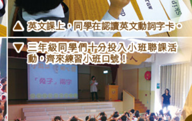
▽三年級同學們十分投入小班聯課活動，齊來練習小班口號！！