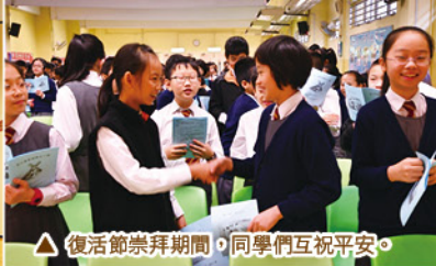
△復活節崇拜期間，同學們互祝平安。