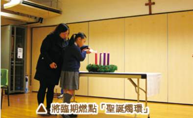
△將臨期燃點「聖誕燭環」