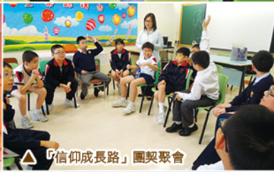
△「信仰成長路」團契聚會