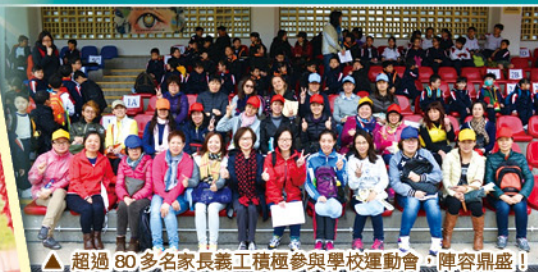
▲超過 80 多名家長義工積極參與學校運動會，陣容鼎盛！