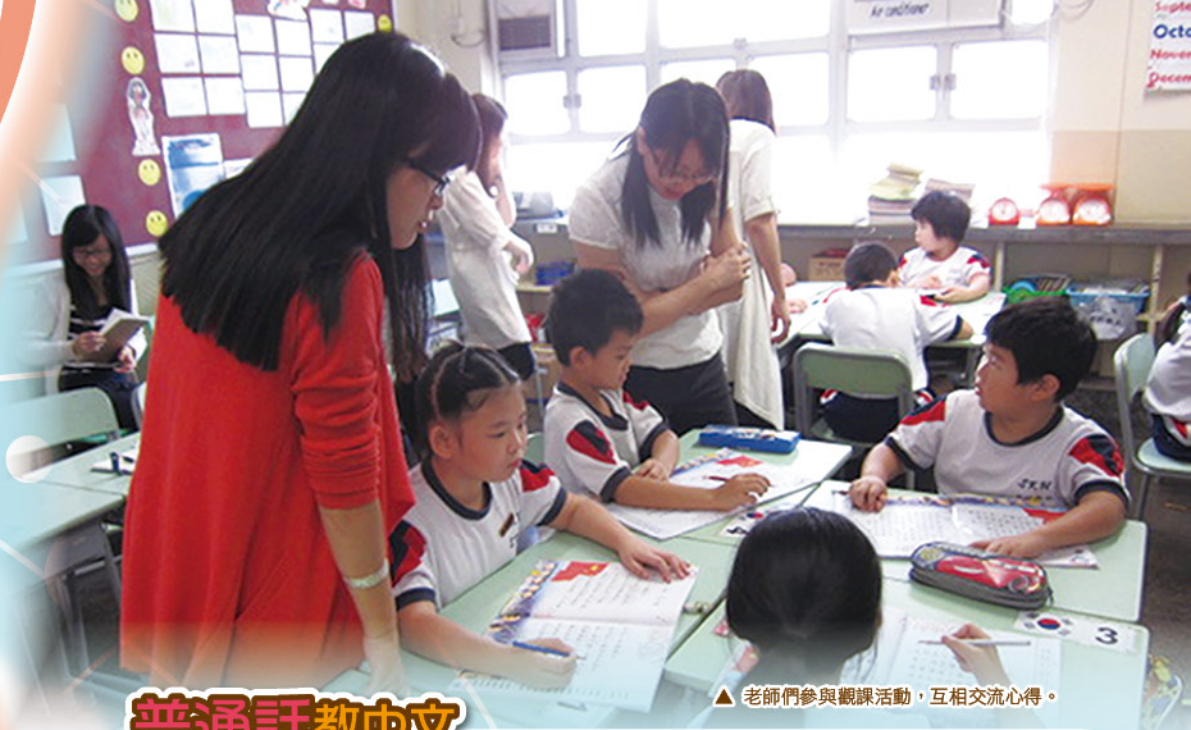
▲ 老師們參與觀課活動，互相交流心得。