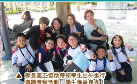
▲家長義工協助帶領學生出外進行專題考察活動，學生獲益良多！