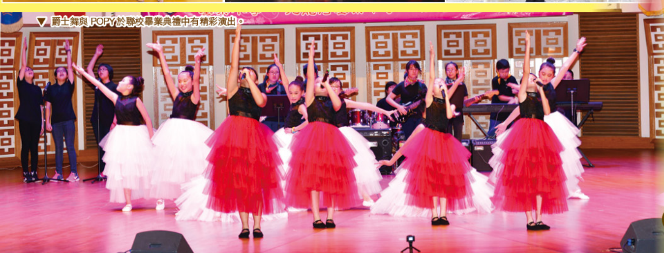
▽ 爵士舞與 POPY 於聯校畢業典禮中有精彩演出。