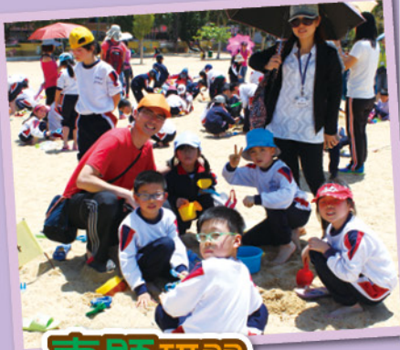
▼二年級的學生到了淺水灣認識沙灘的設施，更有機會進行堆沙活動，真有趣！