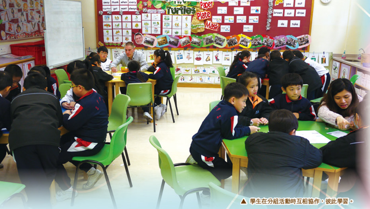
▲ 學生在分組活動時互相協作，彼此學習。