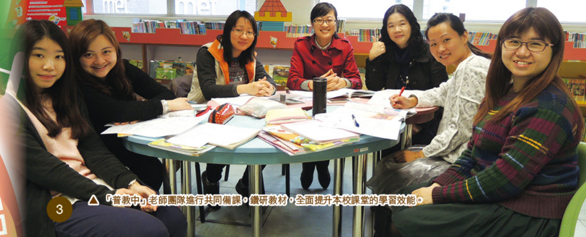
▲ 「普教中」老師團隊進行共同備課，鑽研教材，全面提升本校課堂的學習效能。