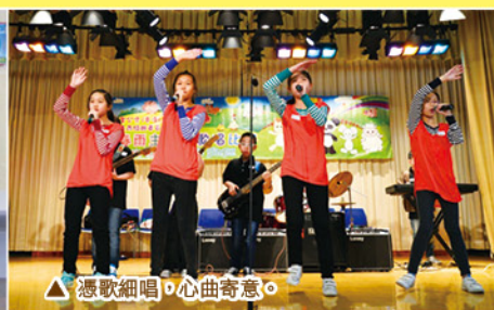
▲ 憑歌細唱，心曲奇意。