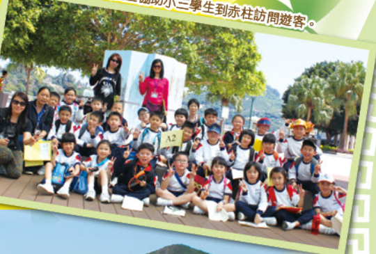
▼ 家長義工協助小三學生到赤柱訪問遊客。