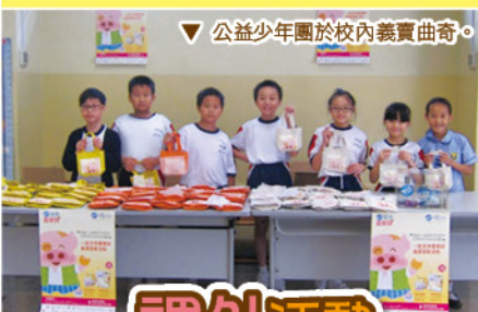
▽ 公益少年團於校內義賣曲奇。