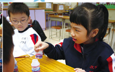
△常識課上，同學專注地注視組員進行探究活動，並積極提出意見。