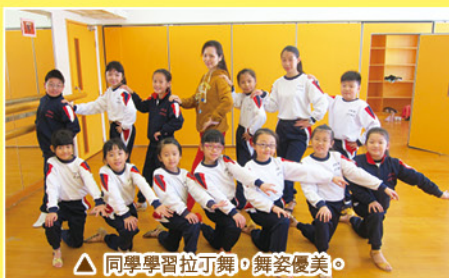
▲ 同學學習拉丁舞，舞姿優美。