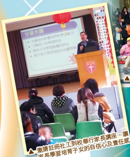
▲邀請註冊社工到校舉行家長講座，讓家長學習培育子女的自信心及責任感。