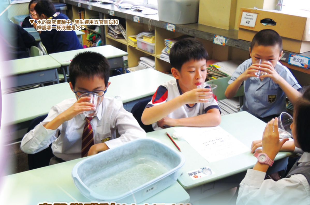
▽ 水的探究實驗中，學生運用五官測試和辨認哪一杯液體是水。