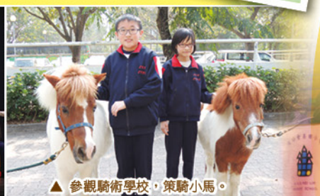
▲ 參觀騎術學校，策騎小馬。