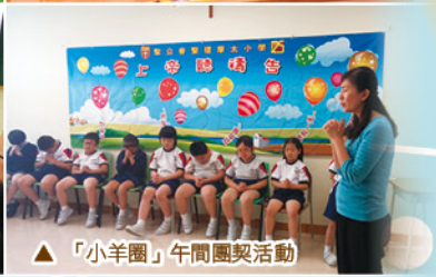
△「小羊圈」午間團契活動