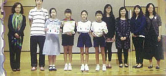
秩序比賽中的得主（各班代表）一同與校長、老師們來個大合照。