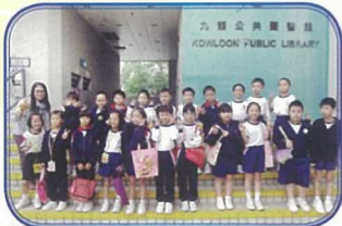
安排小二學生參觀九龍中央圖書館，教授學生善用社區資源，養成良好的閱讀習慣。

在閱讀方面，我校仍會於每周內設立兩天十五分鐘的早讀課，也安排各級學生作定期「閱讀分享」活動。同時，我校新增一項「Morning DEAR」計劃，鼓勵師生善用早讀時段，一同閱讀，營造更佳的閱讀文化。又為小一及小二學生安排「跨級伴讀」活動，以提升朋輩間的互助精神，培養高年級學生的責任感，營造校園內團隊關愛的氣氛。