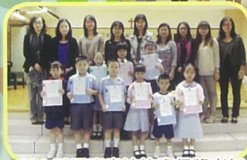
別小看這班書法比賽得獎者年紀小小，但他們的字體十分端正秀麗。