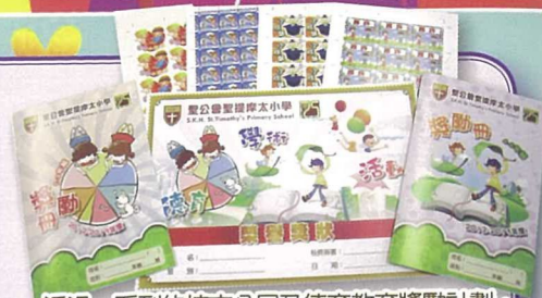
透過一系列的校本公民及德育教育獎勵計劃，提升學生的自信心，建立校園的關愛文化。

針對關注事項三，今學年，校方仍會善用早禱、周會、班任課及成長課，以「關愛」為重點主題，進行生命教育課。同時，亦透過一系列的校本成長計劃，如服務生培訓、校本公民及德育教育獎勵計劃（如「關愛行動」及「守時我至醒」等各項校本獎勵計劃）、義工服務計劃等，提升學生的自信心，建立校園的關愛文化。又為學生舉辦多類型的資訊講座（如濫用藥物、健康資訊及網上欺凌等），以及開心水果日活動，提升學生的認知層面，並讓學生從參與中實踐關愛。在靈育培養方面，校方更透過定期性早禱、周會、宗教課及各項宗教活動（如禮儀崇拜、紅土黃田聯校探訪社會服務機構、聯校團契活動及午間團契活動等），讓學生體會神的慈愛與大能，憐憫與寬恕，增進學生靈育成長，建立正面人生價值觀。