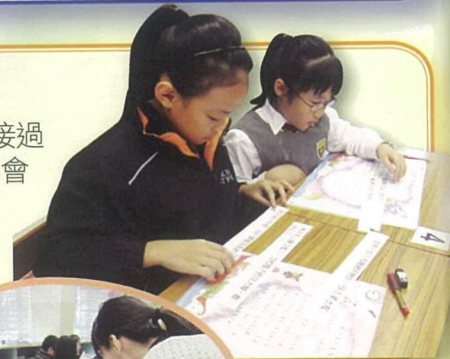
在普教中課堂內透過角色扮演、小組活動，提升學生聽說普通話能力，改善語文學習效能。

今年度，校方會繼續於二至四年級推行以「普通話教授中國語文科」計劃。承接過去三年推普計劃的發展成果，本校已逐步建立一隊完備的普教中教師梯隊，同時亦會汲取過去數年的教研成果，以定期性的共備及研課活動，積極為語文課堂安排及設計多元化的學習活動及評估，全面發展學生的語文能力及興趣。此外，校方更全力為學生營造語境，如於周五早會設立「普通話早禱時段」，以及於周會上設立「普通話活動時段」，好讓全校師生有更多聽說普通話的機會。