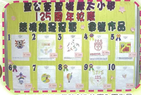
125周年校慶親子徽號創作比賽入圍作品。