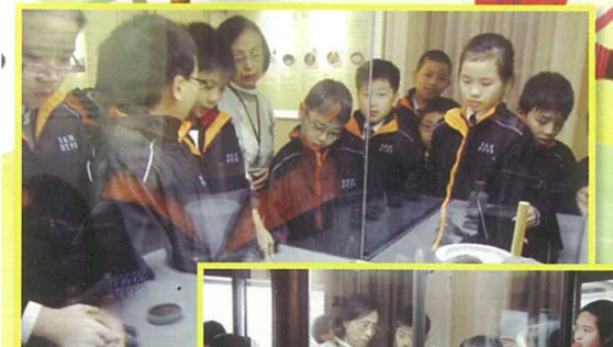
五年級學生參觀茶具博物館，擴闊視野。