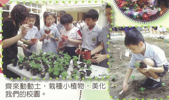
齊來動動土，栽種小植物，美化我們的校園。