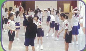
舉辦「領袖生培訓活動」，讓領袖生透過分組活動，學習如何當一名稱職的領袖生。