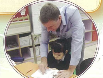
小一英文課堂生動有趣，學生學習認真、投入。