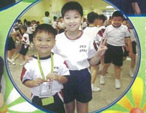
在「關愛大哥哥大姐姐」獎勵計劃中，大哥哥大姐姐充分發揮同儕互助精神，悉心照顧小一新生。

在「跨級伴讀」活動中，大哥哥大姐姐陪同每位小一生一起閱讀，令全校禮堂充滿溫馨，大哥哥大姐姐教得很認真，小一學生也學得很開心投入。