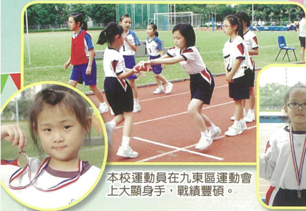
本校運動員在九東區運動會上大顯身手，戰績豐碩。