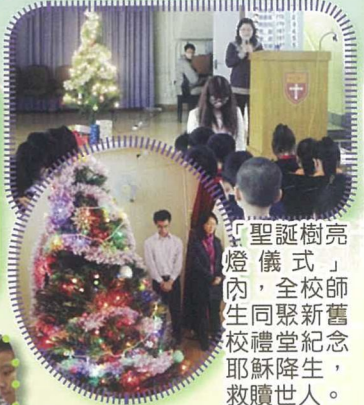
「聖誕樹亮燈儀式」內，全校師生同聚新舊校禮堂紀念耶穌降生，救贖世人。