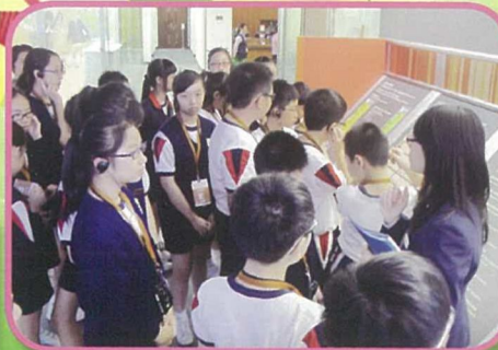
六年級學生到立法會綜合大樓參觀，擴闊學生視野。