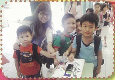
齊來參與「公益金便服日」，捐出金錢，彰顯關愛，體驗助人為樂的意義。