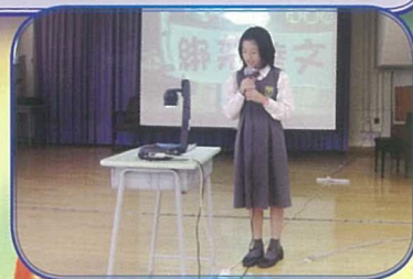
在好書分享活動中，學生透過介紹好書，互相分享、學習。