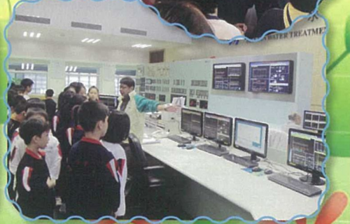
四年級學生到瀘水廠參觀，認識水的過濾過程。