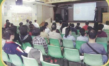
為小六家長學生講辦升中講座須知。