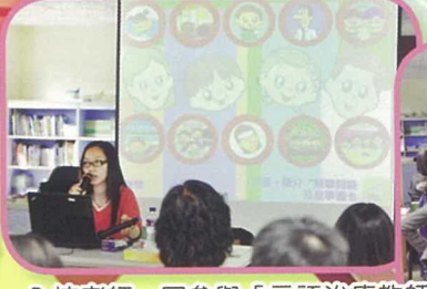
全校老師一同參與「言語治療教師工作坊」，提升專業知識。