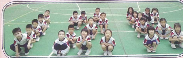
看我們用肢體拼出「125」字樣，多有創意！