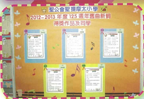
125周年校慶親子舊曲新詞創作比賽得獎作品。