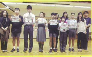
於「小五小六精英獎勵計劃」中得獎學生與校長、老師們合照。