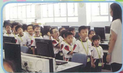
老師帶領小一學生參觀提摩太校園，認識校園設施，投入愉快校園生活。