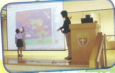
早讀課時，老師用心為小一生介紹中英文好書。