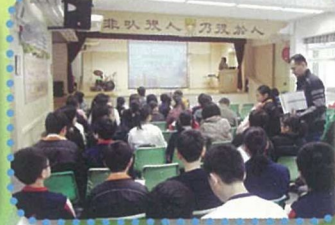
為小六家長舉辦「中一學位分配學位」講座。