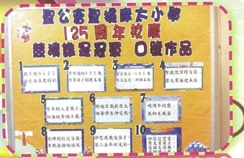
125周年校慶親子口號創作比賽入圍作品。