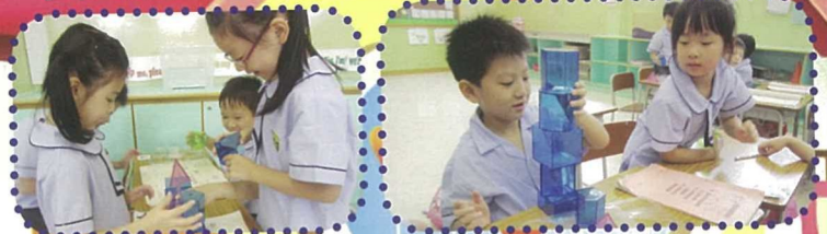
透過實際操作來加強學生對立體圖形的概念。

此外，於今學年，數學組方面繼續參加了校本支援計劃，透過定期與校本支援組高級課程發展導師曾倫尊小姐開會，一同以課研及觀課形式，就小四及小五課程，針對學生的學習難點及弱點，共同商議適切有效的學習活動，以積極提升學生學習數學的興趣，鞏固學生的數學概念，改進學生的學習效能。