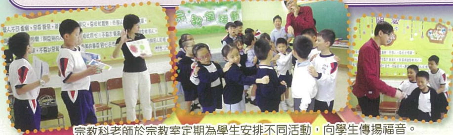
宗教科老師於宗教室定期為學生安排不同活動，向學生傳揚福音。