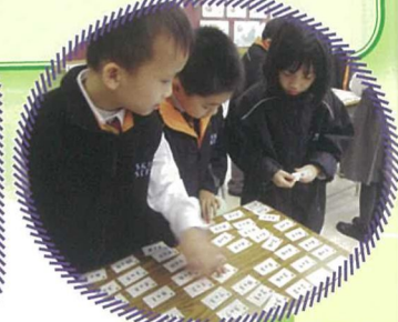
同學十分投入參與小一數學大本營安排的益智有趣的數學遊戲！