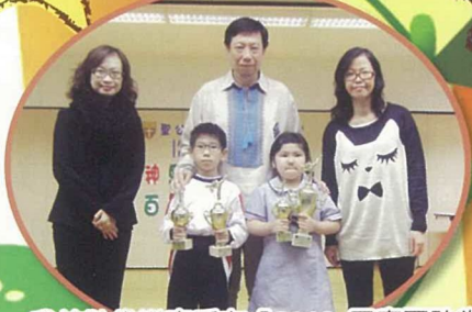
我校跆拳道高手在「2012 國慶盃跆拳道套拳大賽」中勇創佳績。