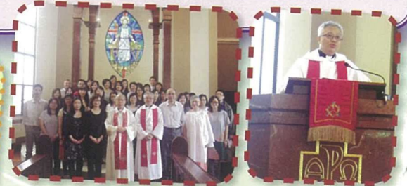
全校教師參與聖匠堂舉辦教師主日崇拜，為新學年獻上感恩與讚美。