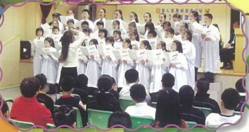
聖誕崇拜中詩班獻唱，歌聲美妙動聽。