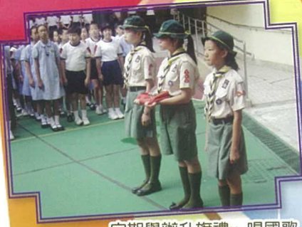
定期舉辦升旗禮、唱國歌，以加強學生對祖國的認識。