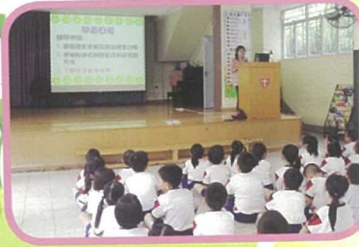
透過聯課活動為小一至小三學生提供小班技巧訓練。