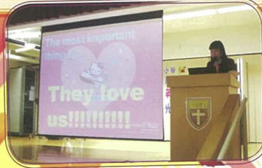
在早會內新加入的「英語時段」，令學生聽說英語的機會增多了。