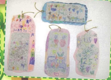
你看我們師生一起自製再造紙，多開心！

除以上兩項啟動活動外，我們還舉辦了「125周年校慶舊曲新詞創作比賽」，而得獎作品亦將成為125周年校慶的主題曲。另一方面，配合125周年校慶，今年度，學校又會以「關愛校園」為研習主題，各科任教師會就此主題為各級設計不同的學習內容。透過有效統整及結合學生不同的學習經歷。同時，為了配合此主題學習，校方更於主題雙周內為各級安排了各類多元化的全校性活動，如「關愛校園125有獎問答遊戲」、由常識科與視藝科組合辦的「『提』紙互傳情活動」等，以提升學生關愛校園的意識。又於校內推行「關愛大使」，「好人好事」關愛行動，讓學生透過活動及身體力行去締造健康和諧的校園。