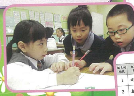
透過分組活動提升學生合作溝通能力。