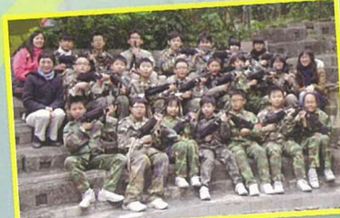
我們一起作戰過，一起成長，一起……