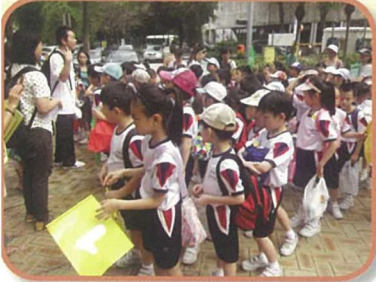
二年級學生到淺水灣一日遊，進行全方位學習，跳出校園，擴闊學習空間。