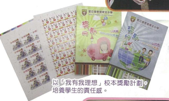
以「我有我理想」校本獎勵計劃，培養學生的責任感。