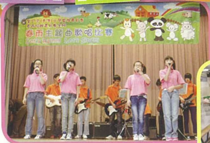
我校POPY樂隊應邀作出席春雨主題曲歌唱比賽的表演代表，各隊員表現投入認真，贏得不少好評。