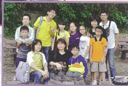
小五家校師生一同參與「紅土黃田栽培計劃」舉辦的聯校旅行。