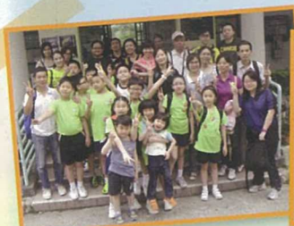
爸爸媽媽放下繁忙的工作，盡情陪子女玩個痛快。