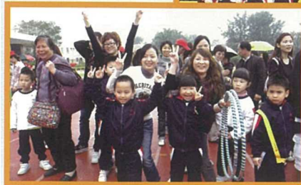
在親子競賽中，家長們與子女打成一片，場面熱鬧溫馨。