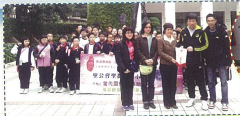
五年級學生參加「當代國情改革開放與經濟發展深圳兩天行」，了解國家目前改革經濟的政策及成就。

此外，課程組與中文組籌劃的祖國如此多‘FUN’活動日，足顯本校能善用學校資源，為學生安排多元化的學習活動，拓闊他們的學習經歷，增強學生的國民意識。是日活動包羅萬有，既有靜態的活動，如摺紙、麵粉公仔等工作坊，也有動態的活動，八個由中、英文科科任老師精心泡製的攤位遊戲，以及由家長義工負責的「民間茶寮」，讓學生既可從遊戲中加深對中國文化及語文的認識，更可淺嚐到不同的中國美食。是日，校方特別邀請了區內幼稚園到校參與活動，達致資源共享，回饋社區目的。期間，我們更安排了「中國民歌共賞」及簡單而隆重的剪綵儀式來歡迎區內的幼稚園，師生更穿著典雅的華服，以支持及響應這次中國傳統文化活動，令整個校園處處洋溢著歡樂的氣氛。