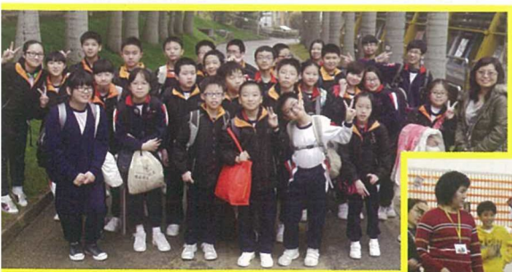
三日兩夜的教育營讓學生體驗群體生活，留下不少美好的回憶。