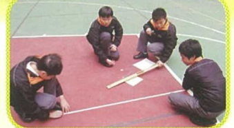
數學科老師為各級安排益智有趣的數學遊踪活動，學生學得投入又開心！