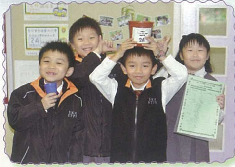
看看各同學用心栽種的成果吧！