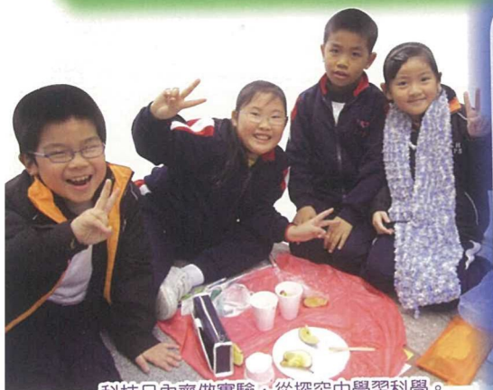
科技日內齊做實驗，從探究中學習科學。

一直以來，學校本著基督仁愛的教育理念，教師們時刻費盡心思，為學生提供優質的教育，開發不同的資源，致力為學生提供不同的學習經歷，為他們打下良好的根基。今學年，我們舉辦了一系列的校內及校外學習活動，校內的活動計有：英文日、祖國如此多‘FUN’活動日、環保科技日及音樂活動日等，校外活動則計有：配合各科發展而舉辦的各類參觀活動，如到香港動植物公園、淺水灣、赤柱、香港科學館及太空館進行專題研習學習活動，又參加了教育局舉辦之「薪火相傳」國民教育活動系列同根同心——香港初中及高小學生內地交流計劃。今次行程的主題為「當代國情改革開放與經濟發展深圳兩天行」。透過今次的跨境活動，不但加深了學生對國家的認識，也讓學生了解到國家目前改革經濟的政策及成就，間接提升了學生的國民意識。