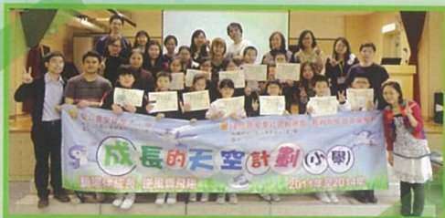
我們在結業禮上來個大合照。