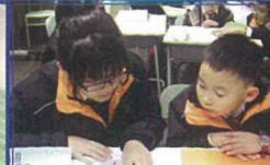
由大哥哥姐姐指導二年級學生閱讀英文書。