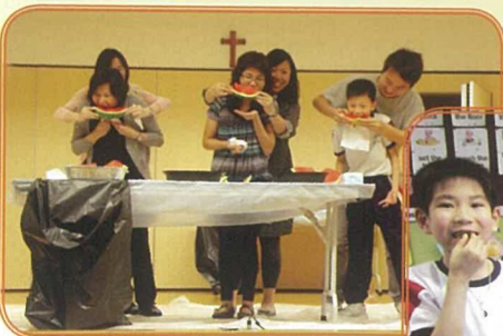
在開心果日，師生齊吃水果，玩玩遊戲，與眾同樂。