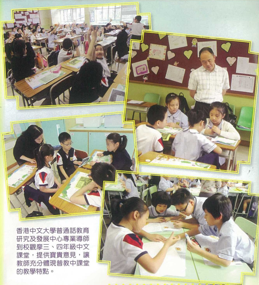
香港中文大學普通話教育研究及發展中心專業導師到校觀摩三、四年級中文課堂，提供寶貴意見，讓教師充分體現普教中課堂的教學特點。

在「以普通話教授中國語文教學」計劃內，校方承接2010年的發展成果，今年度安排了小三及小四級別科任老師參與了香港中文大學普通話教育研究及發展中心提供的顧問服務—校本教材的開發支援計劃。計劃中，教師定期與專業顧問導師進行教研活動，為語文課堂安排及設計多元化的學習活動及評估，以全面發展學生的語文能力及興趣。此外，更全力為學生營造語境，如於周五設立「普通話早禱時段」，以及於週會上設立「普通話活動時段」，好讓全校師生有更多聽說普通話的機會。三年計劃至今，進展理想，學生聽說普通話能力有一定的水平，教師以普通話教授中文的信心也大增了。此成果將成為我校下年度發展「以普通話教授中國語文教學」的重要依據。