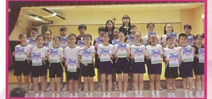
在跨級伴讀中表現優異的大哥哥大姐姐與老師合照。