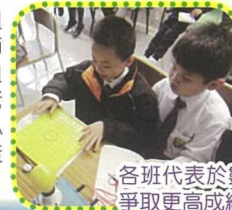
各班代表於數學比賽內各顯本領，期望爭取更高成績，勇奪冠軍寶座。