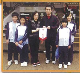
校長代表學校頒發感謝旗予參加友校邀請賽的隊員。