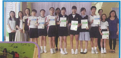
第六十三屆香港學校朗誦節普通話朗誦獲獎同學與校長、老師來個大合照。