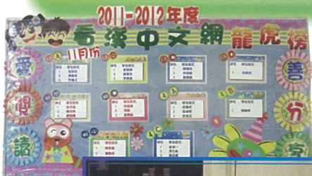
有系統的勵計劃，面擴閱學的閱讀面。閱讀興。

我校於今學年承接過去三年的發展路向及成果，檢視校務發展的強弱機危，重新制訂了三年(2011-2014)學校發展計劃，釐訂了本學年三大關注事項：（一）優化教與學策略，培養學生積極自主的學習態度，增強學生各方面的學習能力及表現；（二）推動教師專業發展，建構學習型團隊，達致自我完善；（三）培養學生積極正向的人生價值觀，建立健康和諧的校園。