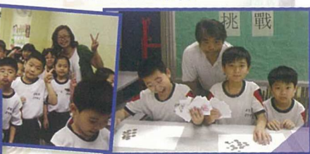
5B班大哥哥大姐姐為一年級同學設下數學擂台，考考他們的數學知識。