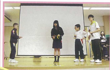
復活節佈道會中，聖匠堂義工團隊藉著唱詩、魔術表演向全校師生傳揚福音。