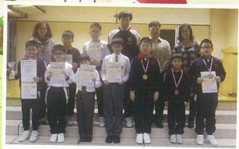
在跆拳道比賽中獲獎的同學與校長、老師合照。