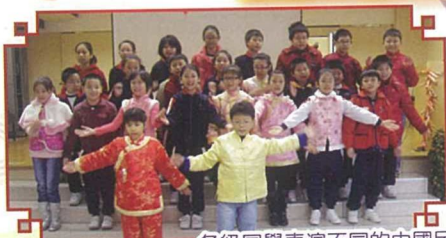
各級同學表演不同的中國民謠，為開幕典禮助慶。