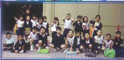
安排小一學生參觀中央圖書館，從小培養良好閱讀習慣。