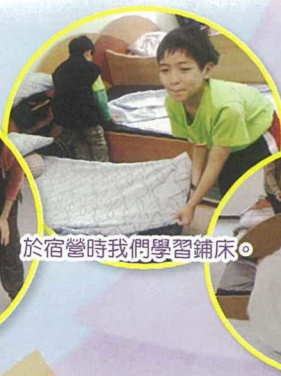
於宿營時我們學習鋪床。