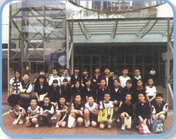
六年級學生到香港科學館參觀，對館內的展品很感興趣。