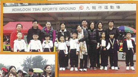
獲獎的家長、學生與校長合照。