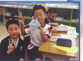
大哥哥大姐姐定期進班與一年級一起閱讀英文圖書，製作小手工。