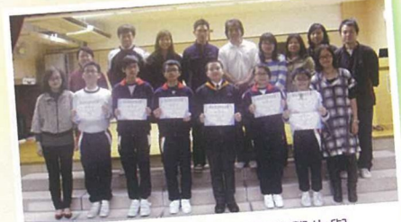
在數學奧數比賽中得獎的學生與校長、老師合照。