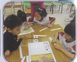
在課堂內貫徹小班教學六大原則，透過分組互動，照顧個別差異，提升學生的學習效能。