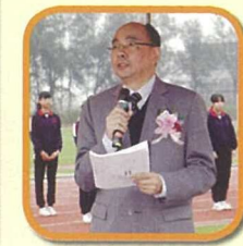
校監向同學們致訓勉，為各參賽者打氣。