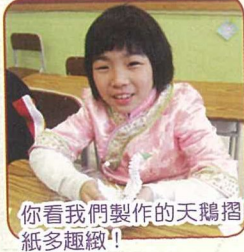
你看我們製作的天鵝摺紙多趣緻！