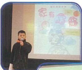
安排閱讀小七錄向同學佳介圖書。

在閱讀方面，我校於每週內設立兩天十五分鐘的早讀課，也安排各級學生作定期「閱讀分享」活動。同時，又為小一及小二學生安排「跨級伴讀」活動，更定期安排各級學生作「好書分享」，藉以提升朋輩間的互助精神，促進彼此間的互動學習。同時，英文組除了在日常課堂進行有系統的閱讀圖書教學活動外，更利用週會或課堂時段定期向學生推介英文故事書。