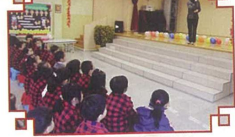
校長代表學校歡迎區內幼稚園生到校，參加祖國如此多‘FUN’這喜慶活動。