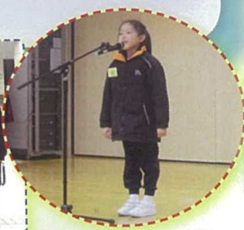
舉辦「古詩齊唱誦」活動，誦詩畫畫，體會中國詩歌意境。