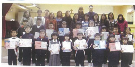
在中文書法比賽中得獎的學生與校長、老師合照。