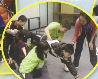
大家合力取禮物，加油！