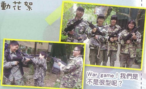
War game! 我們是不是很型呢?