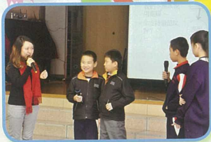
為小一至小六學生舉辦言語治療講座，改善學生說話能力。