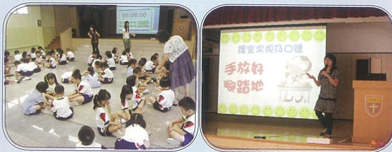
為小班班別舉辦技能訓練聯課活動，強化學生小組活動的社交技巧能力。

計劃推行至今，大部份教師都認為小班教學確能提升課堂效能，改善了師生間關係，且能給予教師較大空間去照顧個別差異。喜見學生的社交溝通能力透過分組活動得到明顯的改進，學生的學習態度更積極投入。