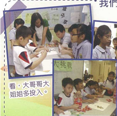
看，大哥哥大姐姐多投入。