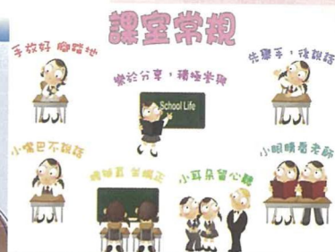
在教室內建立良好班規及完善的獎勵機制，促進小組活動的成效。