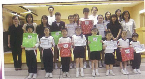
在秩序比賽中獲得最佳表現獎的班別代表與校長、老師合照。