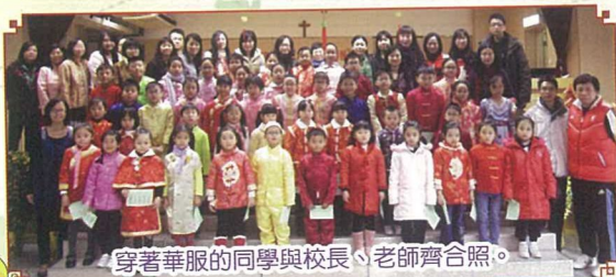
穿著華服的同學與校長、老師齊合照。