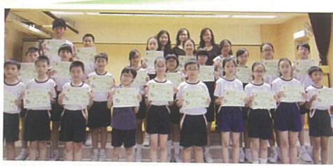
在精英獎勵計劃中表現優異的同學與校長、老師合照。