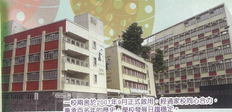
一校兩舍於2007年9月正式啟用，經過家校同心合力，秉承百多年的歷史，學校發展日趨穩定。

今學年，學校秉承百年創校的優良傳統，在神的眷祐、校長的領導及一群承責教師的群策群力下，我們勇對一浪接一浪的改革，並堅守著學校辦學信念及宗旨，貫徹學校校訓「非以役人，乃役於人」的精神，上下一心，全心全意地為學生提供優質的教育。讓學校的校務發展穩步向前，在區內教育事工不斷發光發熱，且深受區內家長們的支持及擁戴。