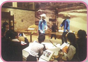
五年級學生到香港歷史博物館參觀，認識香港歷史故事。