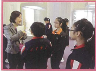
視藝科老師帶領五年級學生參觀茶具博物館，同學們表現得很感興趣。