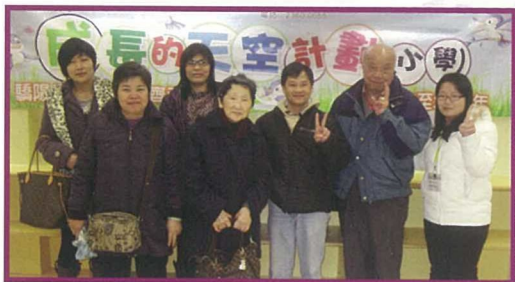
3P正策家長小組順利完成，讓父母掌握不少管教子女之秘訣。