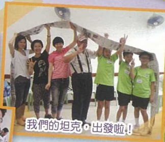
我們的坦克，出發啦！