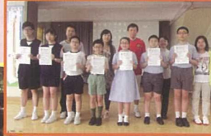
在澳洲新南威爾斯國際評估試中，獲得優異成績的同學與老師們合照。