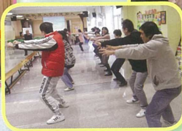
全校老師一同參與「轉壓為力」及「班級經營」工作坊。