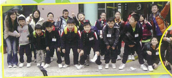
參與兩日一夜之宿營，大家都興奮。