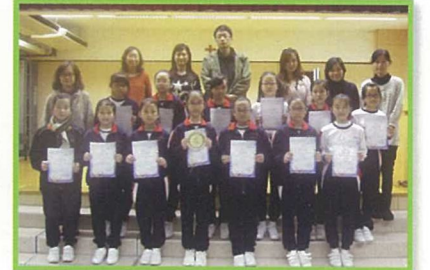
在「第七屆小學生中英文現場作文比賽」中得獎的同學與校長、老師來個大合照。