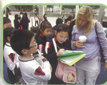
三年級學生到赤柱參觀，並嘗試用外語訪問遊客，擴闊學習經歷。