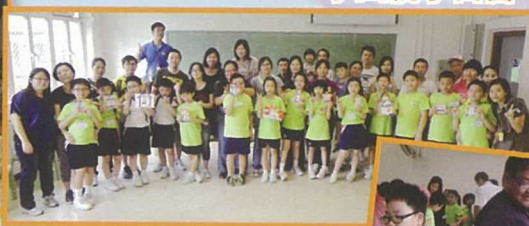
一起完成愛心相架，留下我們美好的回憶。