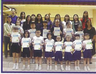
第六十三屆香港學校朗誦粵語朗誦得獎的同學與老師合照。