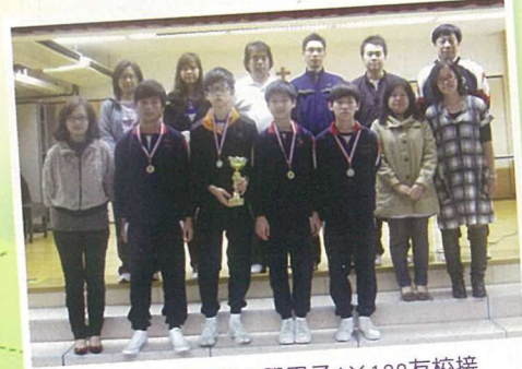
在聖公會基樂小學男子4×100友校接力邀請賽獲亞軍的運動健兒與校長、老師合照。