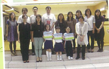
在經文朗誦比賽中獲獎的同學與校長、老師合照。