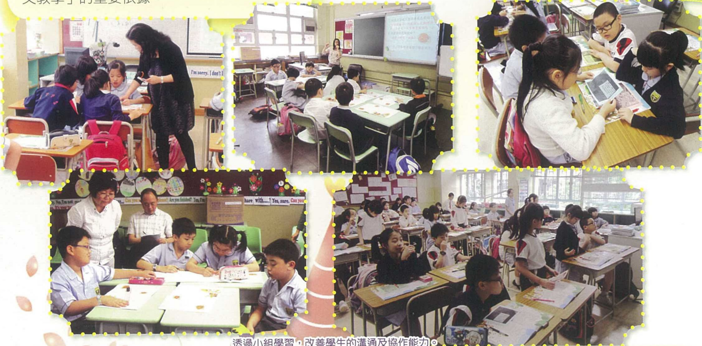
透過小組學習，改善學生的溝通及協作能力。