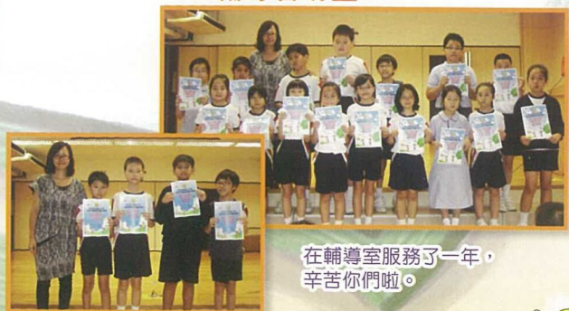
在輔導室服務了一年，辛苦你們啦。