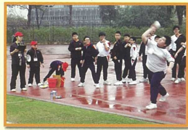
嘩！看看我推球的英姿，多神氣！