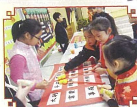
各攤位遊戲活動各具特色，同學們都玩得投入、開心。