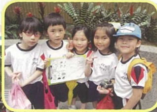
一年級學生到動植物公園參觀，進行專題研習，各人都顯得異常興奮。