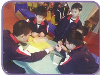
四年級學生到科學館參觀，搜集專題資料，擴闊課外知識。