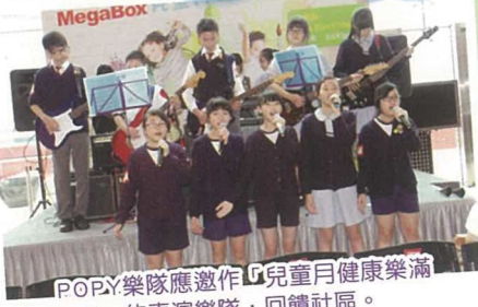
POPY樂隊應邀作「兒童月健康樂滿FUN」的表演樂隊，回饋社區。