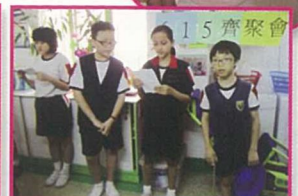
6.15齊聚會，義人特工隊為老人院的公公婆婆獻上魔術表演、美妙的歌聲及豐富的禮物。