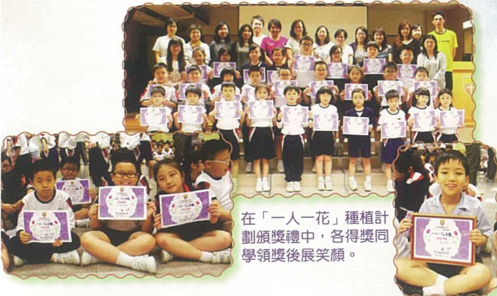
在「一人一花」種植計劃頒獎禮中，各得獎同學領獎後展笑顏。