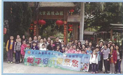
一年一度的親子旅行日，師生家長齊參與，旅程特別溫馨、開心。