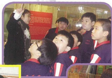
五年級學生參觀玩具天堂，眼界大開。