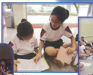
「跨級伴讀」活動中，大哥哥大姐姐陪同每位小一學生一起閱讀，令全校禮堂充滿溫馨。