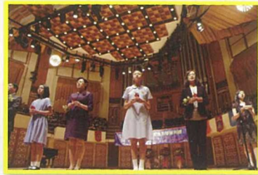
聯校畢業典禮中學生代表與六校校長參與「傳光禮儀式」，象徵薪火相傳。