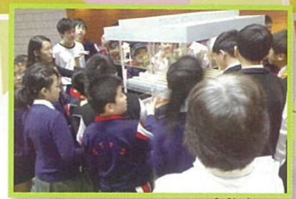
六年級學生參觀辛亥百年紀念館，擴闊視野。