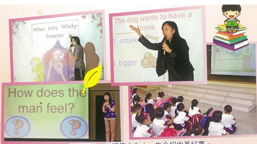
早讀課時，老師用心為小一生介紹中英好書。