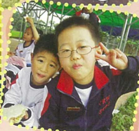
戶外學習日當天，全校師生到上水展能運動村渡過了開心愉快的一天，熱鬧開心的場面隨處可見。