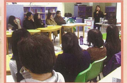
為教師舉辦校本言語治療教師講座：如何在課堂上提升學生的邏輯表達能力。