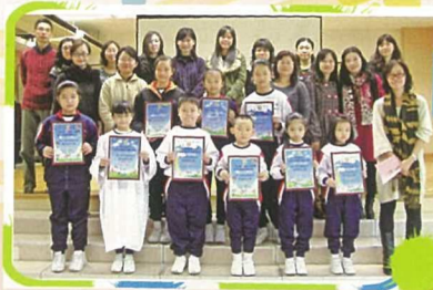
在「親子綠色健康生活」標語創作比賽中的得獎者與校長、老師齊合照。