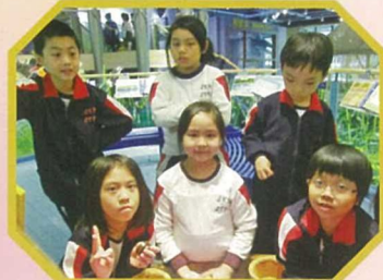
視藝科老師帶領三年級學生參觀香港文化博物館，令學生們眼界大開。