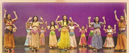
本校拉丁舞組於第 39 屆全港公開舞蹈比賽榮獲西方土風舞少年組銀獎。