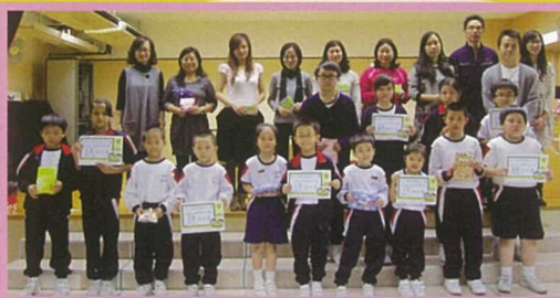
在秩序比賽中獲獎的同學與校長、老師合照。