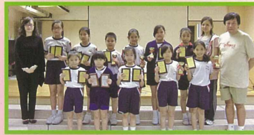
本校拉丁舞組於多項校外比賽中屢獲佳績。