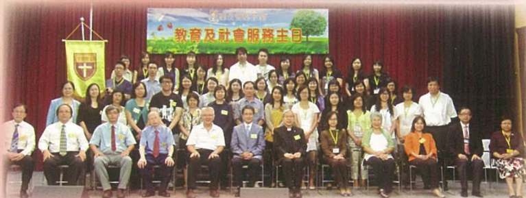
全校教師參與聖匠堂舉辦之教育及服務主日。