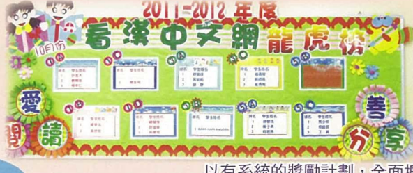
以有系統的獎勵計劃，全面擴闊學生的閱讀面及閱讀興趣。