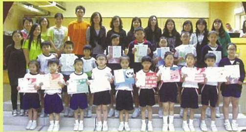
在中文書法中獲獎的同學與校長、老師齊合照。