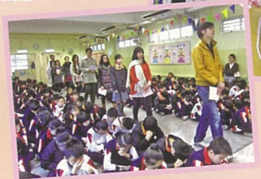
全校師生參與聖誕崇拜，紀念主耶穌的降生。