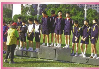
本校田徑隊又再報捷，於基樂小學接力賽中勇奪冠軍，真威風！