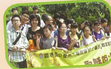
小五學生、家長一同參與「紅土黃田栽培計劃」中舉辦的聯校旅行。