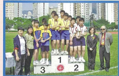
本校田徑精英在油塘基顯友校邀請賽勇奪亞軍。