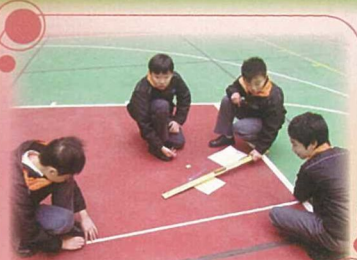
數學科老師為各級安排益智有趣的數學遊踪活動，學生學得投入又開心！