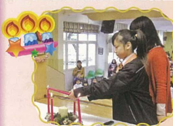
於聖誕崇拜，全校師生參與燃點象徵耶穌降生的蠟燭儀式。