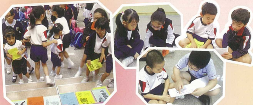
在「跨級伴讀」活動中，大哥哥大姐姐陪同每位小一學生一起閱讀，令全校禮堂充滿溫馨，大哥哥大姐姐教得認真，小一學生也學得開心、投入。