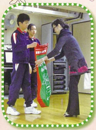
「聖誕崇拜」中師生齊聲歌頌主耶穌之餘，亦舉行捐獻活動，傳達愛心。