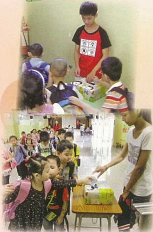
齊來參與「公益金便服日」，捐出金錢，彰顯關愛精神。