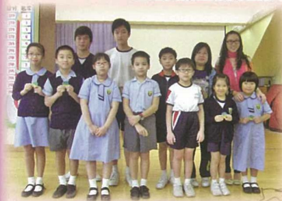
委任學生充當禮貌大使，宣揚禮貌信息。