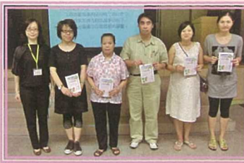
為小一及幼稚園家長舉辦「親子伴讀證書」活動，促進親子關係。