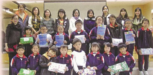
在「愛心大哥哥大姐姐計劃」中得獎的學生與校長、老師齊合照。