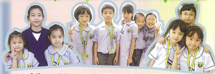
在「愛心大哥哥大姐姐」獎勵計劃中，大哥哥大姐姐充分發揮同儕互助精神，悉心照顧小一新生。

我校於今學年承接過去三年的發展路向及成果，檢視學務發展的強弱機危，重新制訂了三年（2011-2014）學校發展計劃，務求本著學校辦學精神，有效善用資源，抓緊學校的發展需要，全力為學生提供基督化的優質教育。於今學年就發展優次，本校釐訂了三大關注事項：（一）. 優化教與學策略，培養學生積極自主的學習態度，增強學生各方面的學習能力及表現；（二）. 推動教師專業發展，建構學習型團隊，達致自我完善；（三）. 培養學生積極正向的人生價值觀，建立健康和諧的校園。