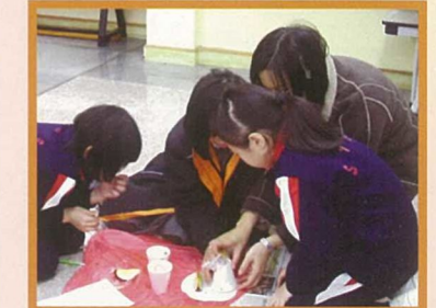
看誰可當最有探究精神的科學家？