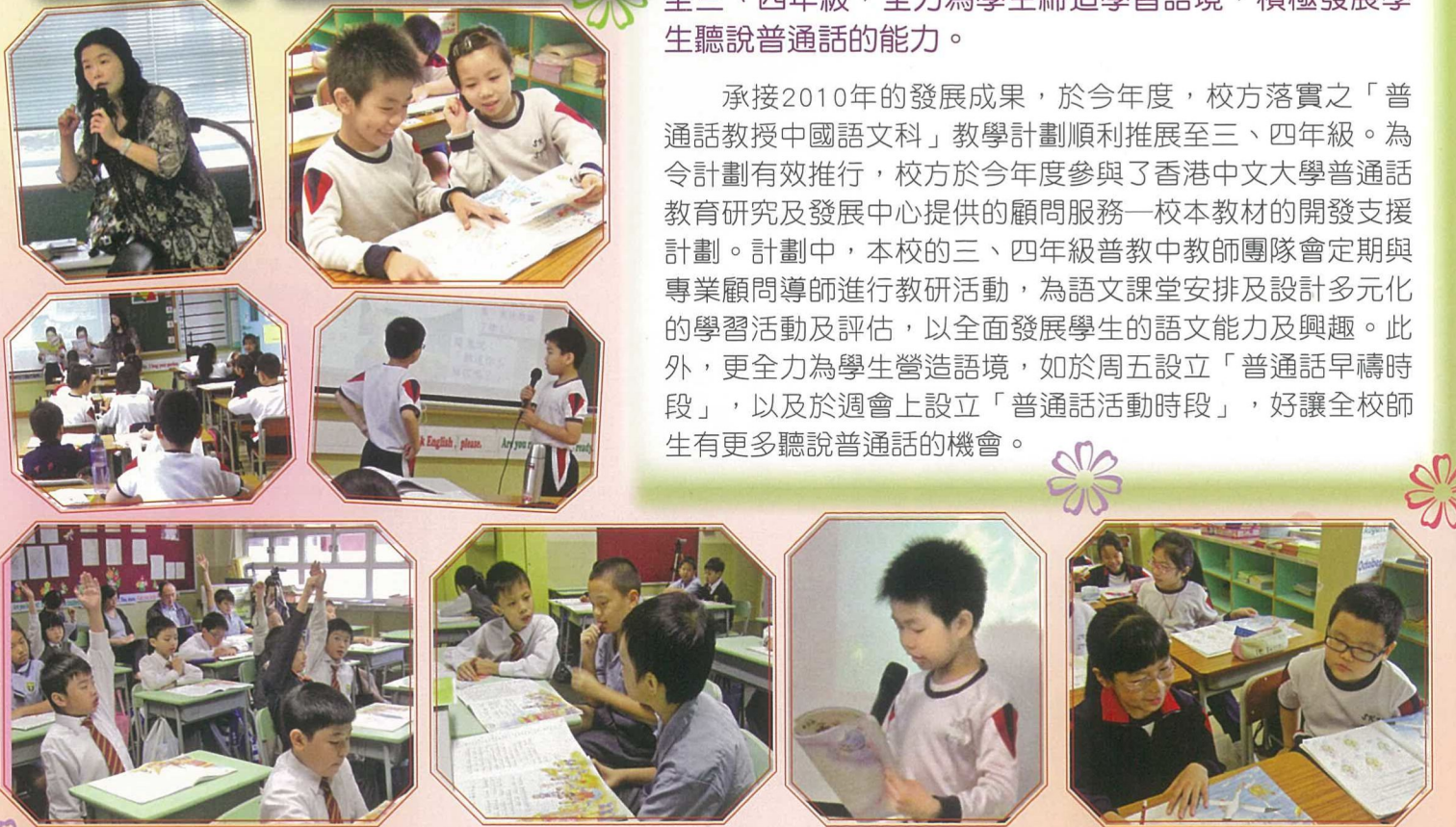
香港中文大學普通話教育研究及發展中心專業導師到校觀摩三、四年級中文課堂，提供寶貴意見，讓教師充分體現普教中課堂的教學特點。

承接2010年的發展成果，於今年度，校方落實之「普通話教授中國語文科」教學計劃順利推展至三、四年級。為令計劃有效推行，校方於今年度參與了香港中文大學普通話教育研究及發展中心提供的顧問服務—校本教材的開發支援計劃。計劃中，本校的三、四年級普教中教師團隊會定期與專業顧問導師進行教研活動，為語文課堂安排及設計多元化的學習活動及評估，以全面發展學生的語文能力及興趣。此外，更全力為學生營造語境，如於周五設立「普通話早禱時段」，以及於週會上設立「普通話活動時段」，好讓全校師生有更多聽說普通話的機會。