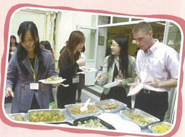
在家教周年大會，家長、教師及學生濟濟一堂，會場內既熱鬧又溫馨。