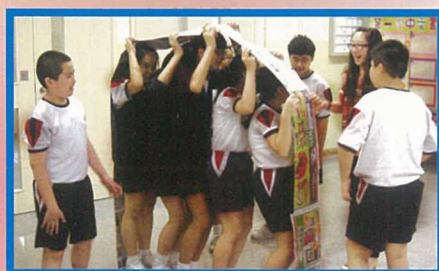
舉辦「領袖生培訓活動」，讓領袖生透過分組活動，學習如何當一名稱職的領袖生。