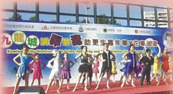
本校拉丁舞組組員應邀參與九龍城滅罪禁毒助更生嘉年華暨花車巡遊表演，把資源回饋社區。