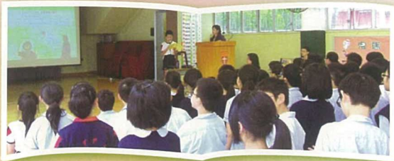
安排各級學生輪流向同級同學分享閱讀心得，營造良好閱讀氛圍。

在寫作方面，為配合新課程發展的需要，全面關顧學生於語文科各大學習範疇的均衡發展，語文科教師會善用各級的共備課堂，一同就教材研討一些單元教學設計的教學重點。透過更有系統的、不同形式的學習活動，全面發展學生的語文學習能力。