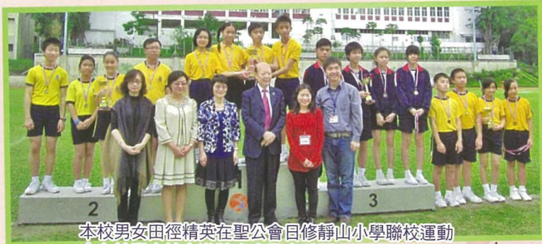
本校男女田徑精英在聖公會呂修靜山小學聯校運動會友校混合接力邀請賽中勇奪季軍。