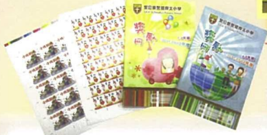
以「我有我理想」校本獎勵計劃，培養學生的責任感。

秉承本校基督辦學精神，有系統地為學生提供各類國情教育及生命教育的學習活動，積極培養學生積極正向的人生價值觀，建立健康和諧的校園。