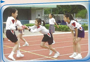
本校運動員在九東遊戲日上大顯身手，戰績豐碩。