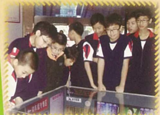
六年級學生參觀香港文化中心，加深對香港文化的認識。