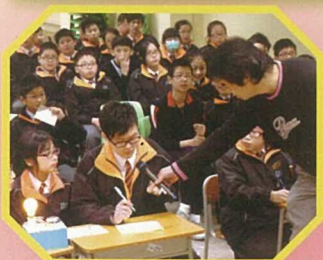
在數學比賽中各同學各顯神通，務求為班爭取最佳成績！