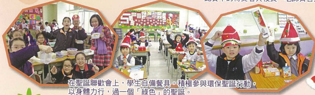
在聖誕聯歡會上，學生自備餐具，積極參與環保聖誕行動，以身體力行，過一個「綠色」的聖誕。