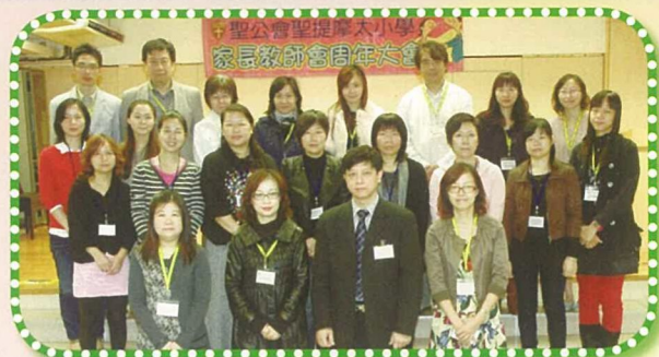
在家長教師會周年大會上，各家長委員與教師委員來個大合照。

今學年，我校更抓緊去年的優勢，針對學生的不同需要，為他們提供更多元化的學習活動。首先，為有效善用資源，不少全校性的活動，如週會、英語活動、普通話活動、各學科的講座（如名作家分享會、藥物及衛生講座……）、家教會周年大會等，校方都會安排在新校舍舉行，這不但可讓每名學生都能享用學校的新設施，也可凝聚全校家長師生的團結及和諧氣氛。