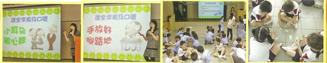
為小班級別舉辦技能訓練聯課活動，強化學生小組活動的社交技巧。

同時，我校更積極鼓勵各科組教師多參與對外科本工作坊或講座，又定期舉辦一些分科研討分享會，著教師向同儕分享個人進修的體會與最新教學資訊，藉以推動教師的專業發展，積極營造良好的學習型團隊。