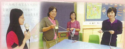
為家長舉辦「學習有妙法」家長支援小組培訓，改善家長與子兒的關係。