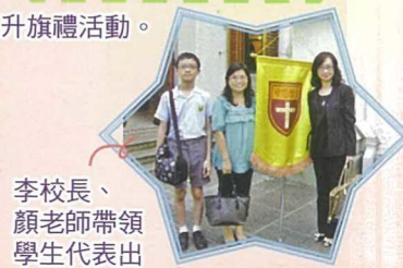
李校長、顏老師帶領學生代表出席聖公會教省教育主日聖餐崇拜。