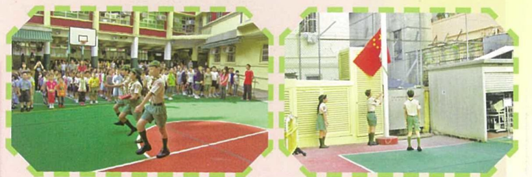
定期安排全校師生參與升旗禮活動。

針對關注事項(三)，校方運用早禱、週會、班任課及成長課，分別以「責任感」及「關愛」為重點主題，進行生命教育課。同時，亦透過一系列的校本成長計劃，如服務生培訓、校本公民及德育教育獎勵計劃(如「我有我理想」計劃、「禮貌行動」校本獎勵計劃……)、義工服務計劃等，培養學生的責任感，建立校園的關愛文化，又為學生舉辦不同的資訊講座(如濫用藥物、各項健康資訊等)，以及開心水果日活動，提升學生的認知層面，並讓學生從參與中實踐健康生活。在靈育培養方面，校方更透過早禱、週會、宗教課及各項宗教活動(如聖誕崇拜、紅土黃田聯校旅行及聯校團契活動等)，讓學生體會神的慈愛與大能，憐憫與寬恕，增進學生靈育成長，建立正面人生價值觀。