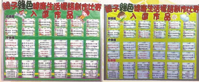
標語創作比賽入選作品展，每個作品都很有創意。