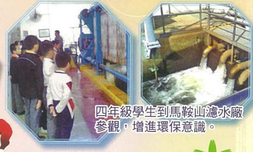
四年級學生到馬鞍山濾水廠參觀，增進環保意識。