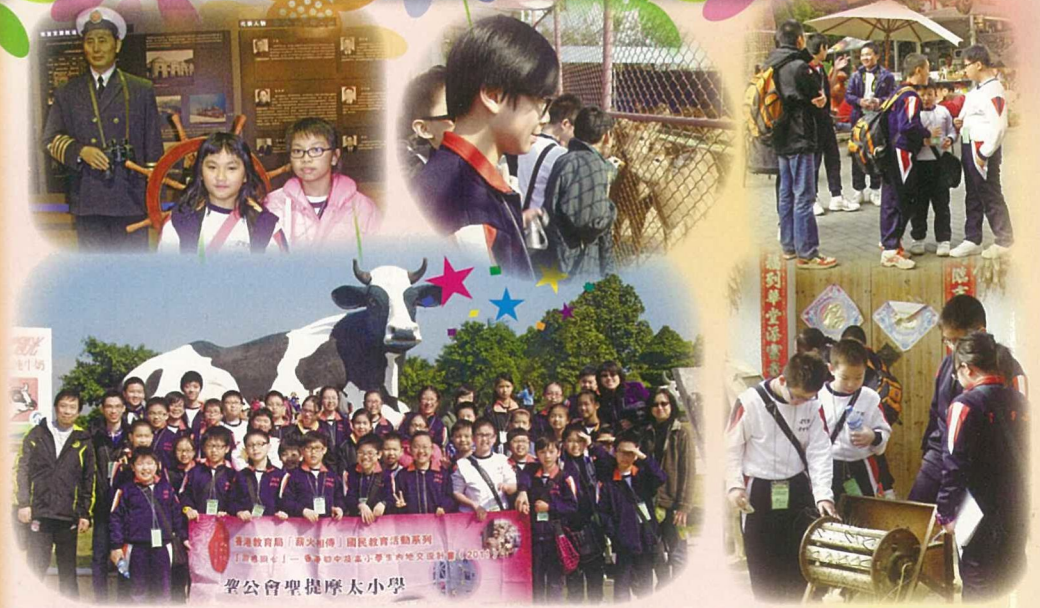
這次跨境活動令同學對國家產業有新認知，且促進了同學與老師間的感情，更可擴闊視野，可謂一舉多得！

此外，校方於愉快學習周內為全校舉辦「祖國如此多紛」跨學科國情教育活動，又參加了教育局舉辦之「薪火相傳」國民教育活動系列同根同心—香港初中及高小學生內地交流計劃，為四十名五年級學生安排了一個跨境學習活動，行程的主題為「當代國情改革開放與經濟發展深圳兩天行」。透過今次的跨境活動，不但加深了學生對國家的認識，也讓學生了解到國家目前改革經濟的政策及成就，間接提升了學生的國民意識。