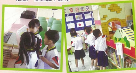
常識科任老師帶領小一生到新舊校舍參觀，提升小一學生對學校的歸屬感。