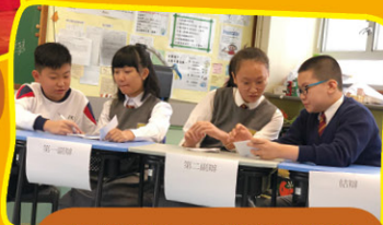
我們努力商討比賽戰略，希望擊敗對手。