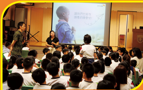
同學對講者問題感到興趣