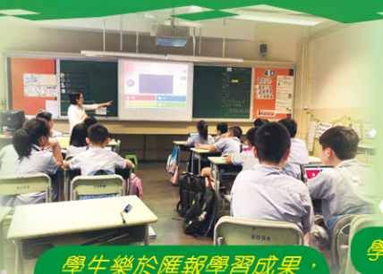
學生樂於匯報學習成果，同學均專心聆聽。