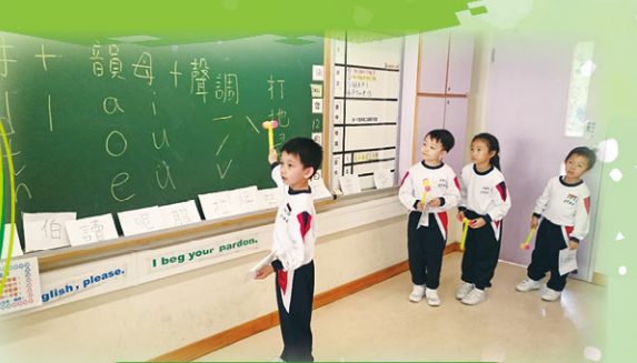
同學們透過有趣的小遊戲學習拼音的概念，非常投入！