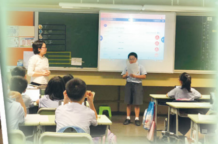
同學在學習平台進行分組比賽，讓學生更投入學習，提高學習效能。