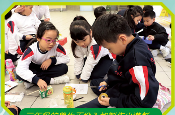
二年級的學生正投入地製作小遊艇。