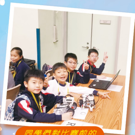
同學們對比賽前的準備充滿信心。