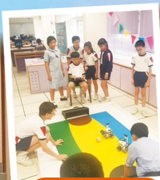
LEGO 足球機械人比賽，好刺激呢！