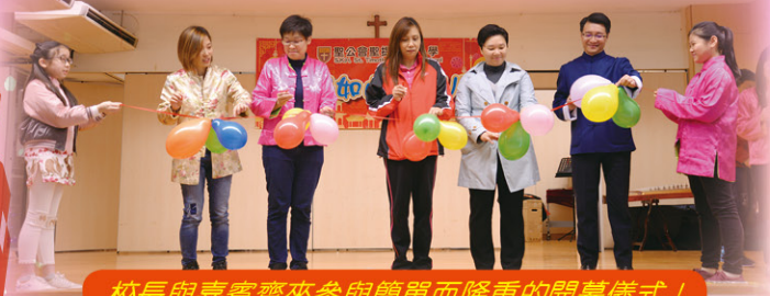
校長與嘉賓齊來參與簡單而隆重的開幕儀式！

於 8-1-2019 當天，本校課程統籌組與中國語文科組、英國語文科組、常識科組、普通話科組及音樂科合作籌辦了一個大型的「祖國如此多 fun」活動，為學生安排多元化的學習活動，豐富他們的學習經歷，增強學生的國民教育。今次活動安排側重向學生灌輸中國傳統文化知識，又為學生安排不同形式的傳統手工藝工作坊（如麵粉公仔製作及紮草蜢），讓不同級別的學生都能透過實作體驗，欣賞及感受中國傳統工藝的精深。是日，校方亦邀請家長義工負責「民間茶寮」，讓學生既可從遊戲及學習活動中加深對中國傳統文化的學習，又可淺嚐到不同的中國美食。此外校方更邀請了區外幼稚園到校參與活動，達致資源共享，回饋社區。活動中，我們安排了「中國樂曲齊齊唱」作為開幕頭砲，以支持及響應這次中國傳統文化活動，令整個校園處處洋溢著歡樂的氣氛。