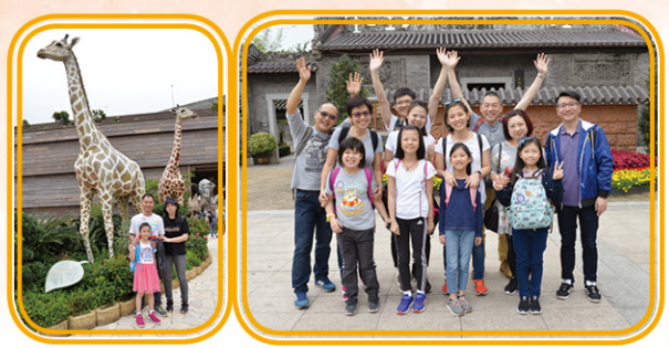
學校與家長教師會合作舉辦親子旅行，超過 600 名家長、學生及老師到「嶺南之風」及「挪亞方舟」旅遊，提升親子關係，更加強對學校的歸屬感。