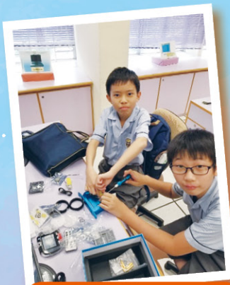
同學用心拼砌機械人。

為進一步強化學生在 STEM 教育發展，學校設有 LEGO 機械人編程班，藉此培養學生於科學、科技、數學等範疇的知識基礎，培養創意力、協作和解難能力，應對將來挑戰。