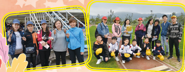
學校邀請多名家長義工協助運動會各項工作，如：計時、召集和接待等，令運動會得以順利完成。

本校向來與家長保持緊密的溝通與合作的關係，以期達致家校合作，提升家長對學校的歸屬感，亦令校內各項活動得以順利舉行，更讓家長了解學生在學的學習情況。而家長教師會各委員更扮演積極的角色，促進學校與家長的溝通及推行家長教育工作。本年度，家校活動包括有：祖國如此多FUN、第十三屆運動會、家長教師會舉辦或協辦的親子旅行、家長講座、午膳家長義工和爸媽說故事等。