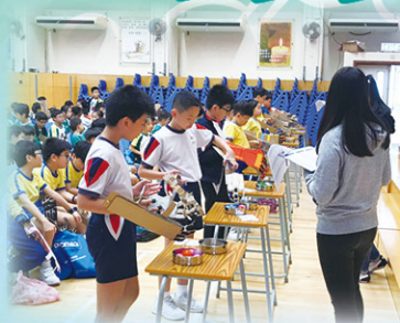
「STEM 香港小學生大獎賽」、「常識百搭」等比賽鼓勵學生主動探索，應用知識去解決困難。