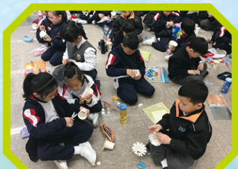
一年級的學生正認真地製作花筒炮。