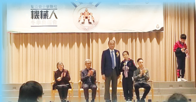
同學於冰壺機械人比賽勇奪最佳編程設計獎項。