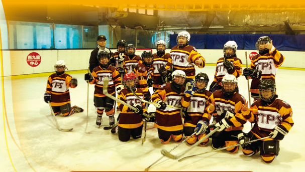
我校雄心壯志的冰球運動員。