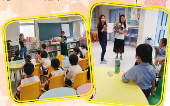
家長義工到校為學生說故事，盡顯家校合作精神！