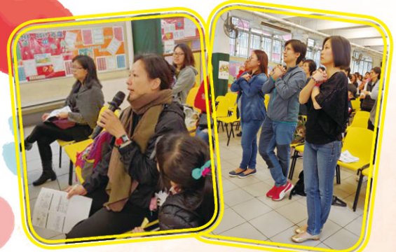
家長教師會舉辦家長講座，家長積極發表意見及身體力行地參與健腦操活動。