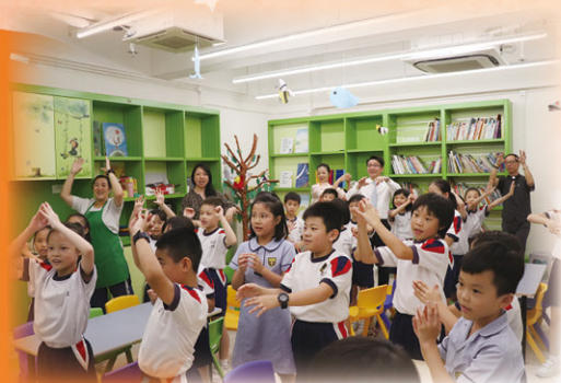
進行熱身活動，同學們手舞足蹈

本校致力發展生命教育，希望提升學生個人成長素質，從而建立正面和積極的人生觀。本校與牧區教會聖公會聖匠堂緊密合作，積極協助本校發展生命教育。