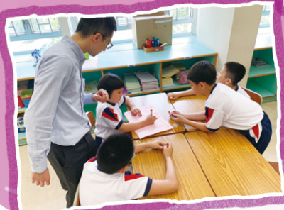
同學們製作腦圖時，一邊提出意見，一邊把意見分類。