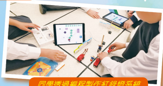
同學透過編程製作紅綠燈系統