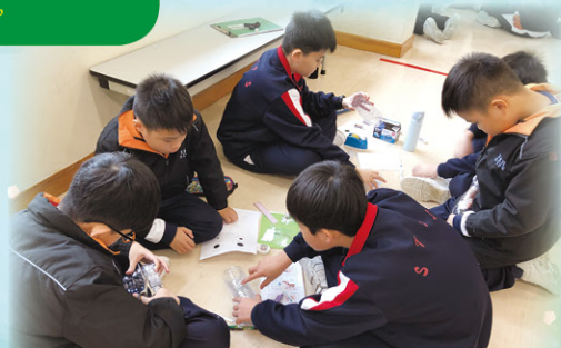
六年級的學生不斷改良，希望能提升「迷你吸塵機」的效果。