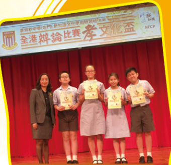
我們都很高興在大型的校際辯論比賽中獲獎。

為了發揮學生的辯論潛能，增強學生的口語溝通、批判思維、邏輯推論等能力，本校組織了中文辯論隊，培育一個個「小小辯論家」。在成立的短短兩年內，中文辯論隊多次參加了校際辯論比賽。在比賽的過程中，同學除了可以培養團隊意識和自信心外，更先後於文化盃（小學）辯論比賽中喜獲亞軍及最佳辯論員獎項，相信同學能汲取經驗，再創佳績。