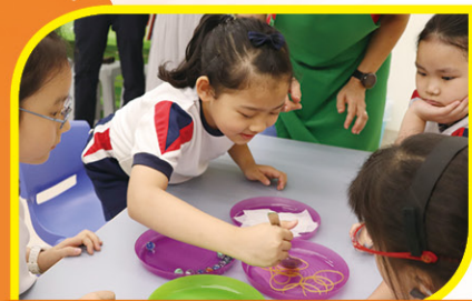
鬥智鬥力體驗活動，同學們表現投入

學校安排二年級學生參觀聖公會聖匠堂「生命繪本館」。學生首先遊訪聖匠堂及生命繪本館，觀賞當中精緻的壁畫，讓學生認識萬物皆由主創造。進入工作室，同學們隨即進行熱身遊戲活動，鬥智鬥力體驗活動。之後，導師們透過繪本故事《叔公的理髮店》，讓學生領略在個人成長過程中，縱使經歷許多困難和挫折，仍能憑着堅毅的心，努力不懈，最終都能達成夢想。