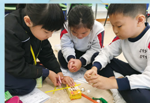
三年級的學生正使用簡單物料，一起製作環保動力車。