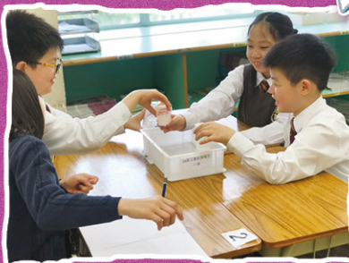
數學課上，同學們合作解決探究活動中的問題，並積極提出意見。

此外，本校重視教師團隊的專業發展。為建立優秀的協作交流文化，本校會定期安排專業交流活動，例如同儕觀課、教師分享會等，不斷提高教師運用分組教學策略的技巧。