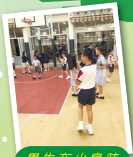
學生在小息時拍攝影片。

整個計劃中，電子課堂設計以教學單元為主軸，分別在聽、說、讀、寫四個範疇滲入電子教學元素，例如讓學生在校園利用 ipad 錄影及拍攝相片，然後利用 Movie maker 製作影片，讓學生加入旁白、背景音樂等後期製作，然後學生可依據影片播放的內容及旁白的資料進行寫作；再者，教師亦利用 Google classroom 的網上學生評估平台，進行「反轉教室」教學；此外，教師還利用電子教學平台，即時與學生進行網上評估、造句練習、網上投票等。這些電子課堂讓學生即時獲得回饋和指導，讓學生主動學習，互相分享，更激發了他們的學習動機及興趣。