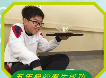
五年級的學生成功製作立體影像投射器，十分興奮呢！