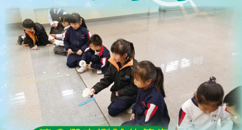
讓我們來測試花筒炮的發射效果吧！