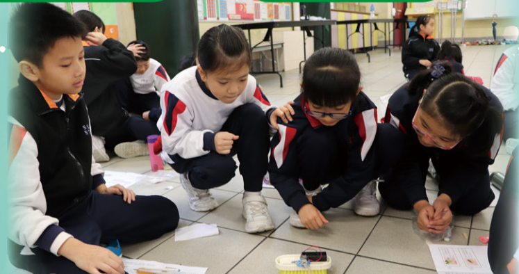
四年級的學生製作的「家務助理機械人」看起來效果不錯啊！