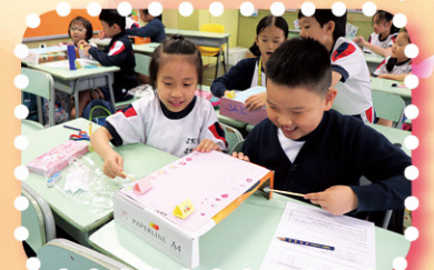
English Day — P.2 students making a magnetic race