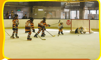
找緊機會，起手施射。