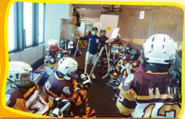
比賽前留心聆聽教練的安排。