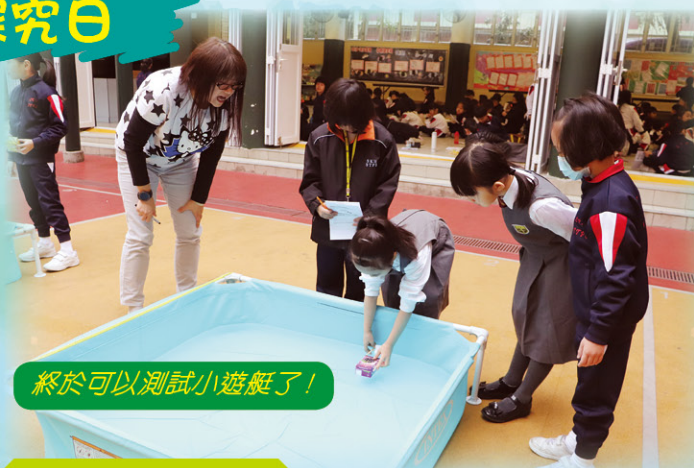
終於可以測試小遊艇了！