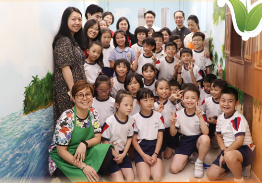
導師與同學們大合照