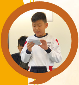
雄辯滔滔的辯論隊員