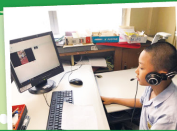
學生專注地錄製旁白及製作短片。