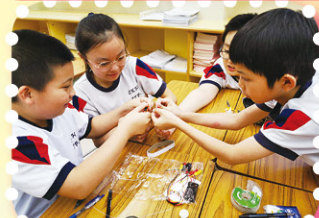
English Day — P.5 students making a buzz wire