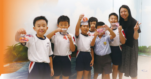
同學開心歡笑，展示親手製的作品

於手工製作活動中，學生設計「夢想襟針」，學習「實踐夢想不在於能力多少，而在於能堅持到底」，以「夢想襟針」為自己打氣，努力求進。