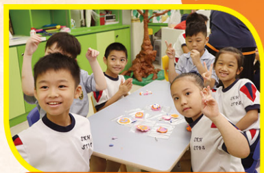
同學們製作「夢想襟針」

於手工製作活動中，學生設計「夢想襟針」，學習「實踐夢想不在於能力多少，而在於能堅持到底」，以「夢想襟針」為自己打氣，努力求進。