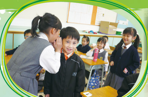
老師跟同學們一起玩「以訛傳訛」遊戲，看同學能否以普通話準確地讀出句子。