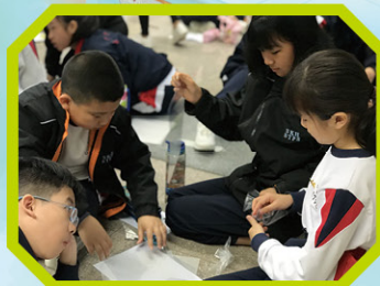
讓我們思考如何利用透明膠片去製作「立體影像投射器」。