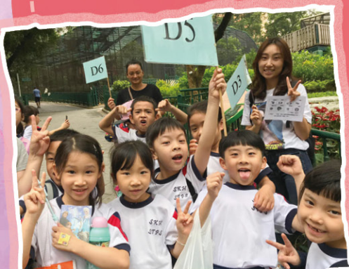
家長義工們也樂在其中呢！