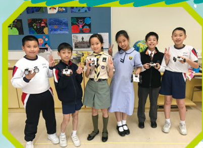
一星期的 STEM 課程有不同的主題，目的是讓學生有更多機會探索。