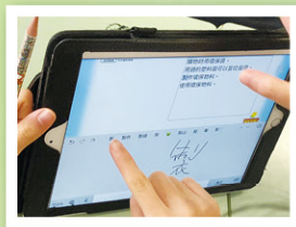
學生即時在學習平台寫出小組的意見及發佈給全班。