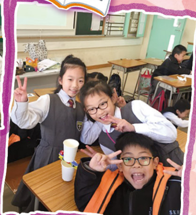
三年級同學們主動運用「合作學習」技巧，完成老師給他們的任務！