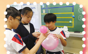
English Day — P.6 students making a balloon rocket