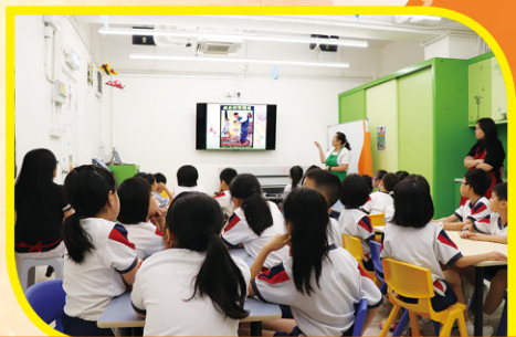
同學用心聆聽繪本故事《叔公的理髮店》

學校安排二年級學生參觀聖公會聖匠堂「生命繪本館」。學生首先遊訪聖匠堂及生命繪本館，觀賞當中精緻的壁畫，讓學生認識萬物皆由主創造。進入工作室，同學們隨即進行熱身遊戲活動，鬥智鬥力體驗活動。之後，導師們透過繪本故事《叔公的理髮店》，讓學生領略在個人成長過程中，縱使經歷許多困難和挫折，仍能憑着堅毅的心，努力不懈，最終都能達成夢想。