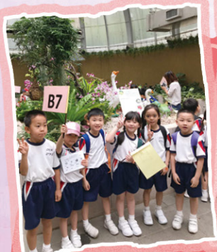
透過參觀溫室，認識不同的植物。