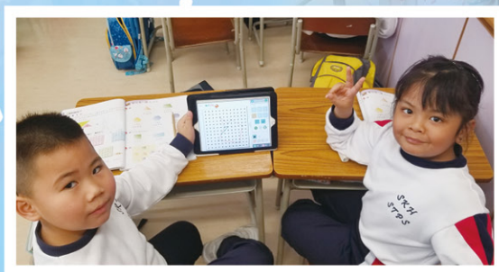
我們利用電子釘板完成任務啦！