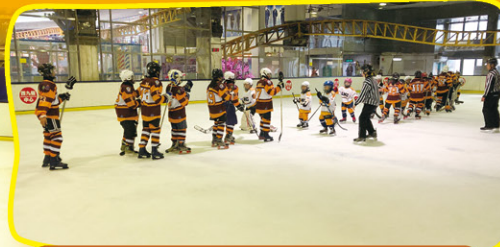
比賽後與對方握手，展示體育精神。