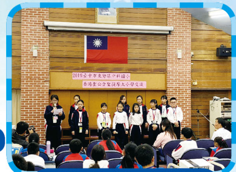
台灣交流之旅，一齊「整餅」。