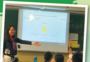
學生觀看短片後，即時進行投票。