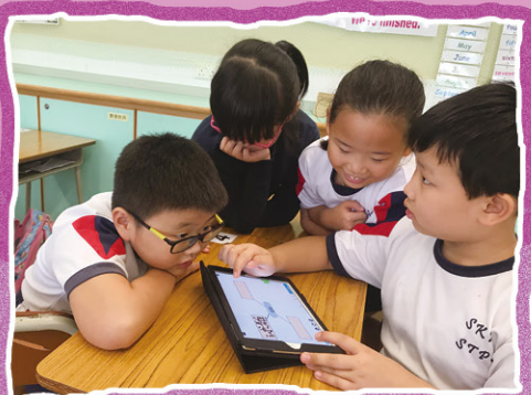
同學們在分組活動中運用平板電腦學習。