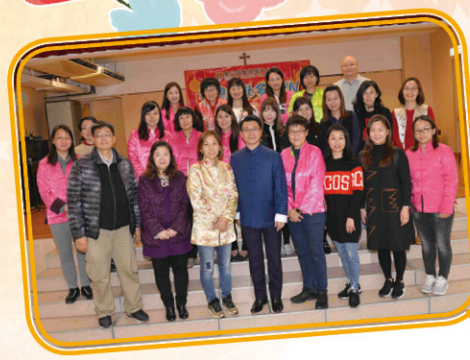
各家長義工齊心合力製作美味的小食，為「祖國如此多FUN」活動增添色彩。