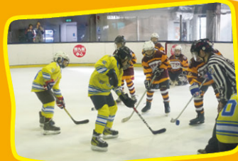
奮勇地抗敵，全力守護。

香港冰球訓練學校和本校合作多年，共同努力推廣冰球活動，讓很多學生從中獲益不少。此外，冰球學校的老師們會非常熱心和耐心地教導我校冰球運動員，使他們不但學會一些冰球技巧，還培養出一些良好品格，如責任感、團隊意識和自信心。