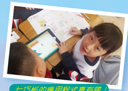
七巧板的應用程式真有趣！