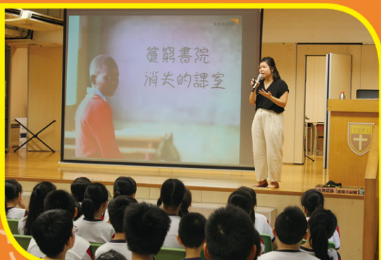
生命教育講座講題：「貧窮書院 — 消失的課室」

本年度學校邀請「香港世界宣明會」到校舉行生命教育講座。講題為「貧窮書院 — 消失的課室」，讓學生認識許多發展中的國家貧困學童的生活情況，以及了解有關食水、家庭、童工、童婚等問題，為兒童上課及學習所帶來的深遠影響。透過生命教育講座，讓小四、小五學生明白應秉持堅毅精神，珍惜上課學習的機會，加強學生對有關生命教育的認識及培養。