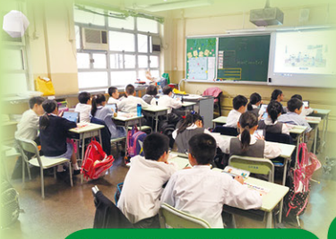
學生在學習平台上即時進行造句練習。