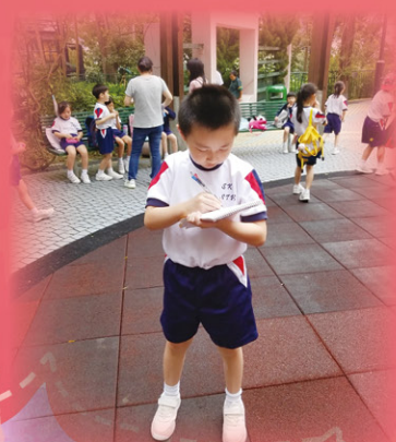
同學用心地記錄公園的設施呢！